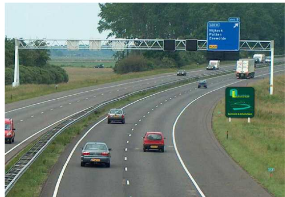
17.00: Uitgerust weer naar huis. Volgende werkdag weer op kantoor in Amsterdam-Zuid.