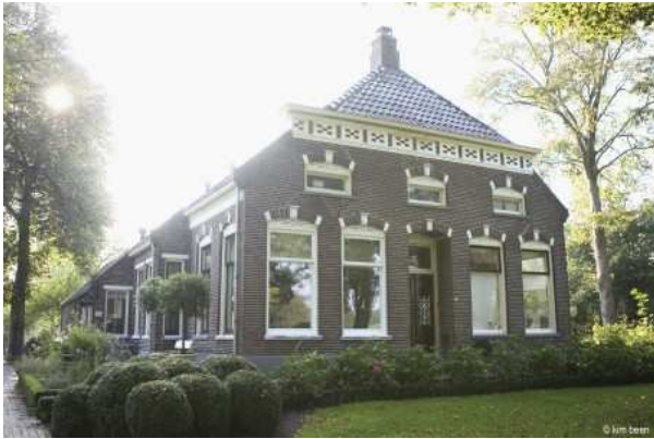
Mijn flexkantoor, elke week op vrijdag