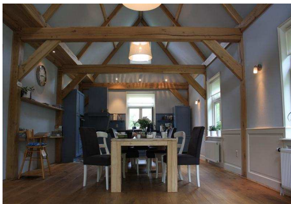
12.30 Bruin brood met boerenkaas in de kantine