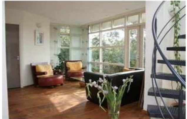
14.00 met lokale ondernemer in de vergaderkamer om financiering te bespreken