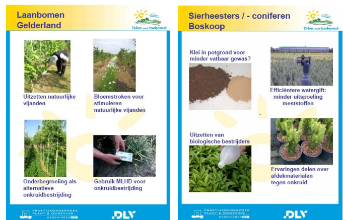
Voorbeelden van Best Practices waaraan in de afgelopen jaren is gewerkt in de gewasgroepen laanbomen en sierheesters/coniferen.