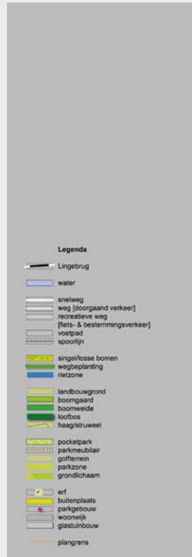
Kaart uit: Stuurgroep Park Lingezegen, 2007 . Een park van formaat. http://www.parklingezegen.nl