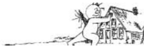
Figuur 1 Wilt u even opzij gaan, het water moet erbij!

Met andere woorden: hoe gaan we om met de kwestie van