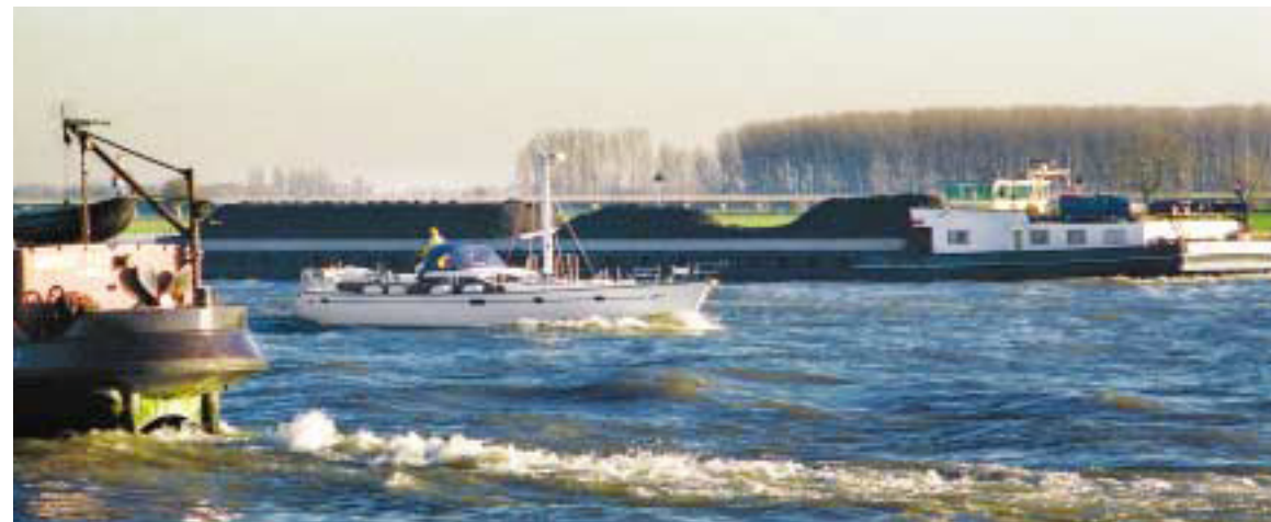
Foto Waal bij Druten

Het is nog te vroeg om te kunnen oordelen of de ruimtelijke kwaliteit in het rivierengebied nu zal toenemen. Deel I (Kabinetsvoornemen) van de PKB Ruimte voor de Rivier verschijnt in het voorjaar van 2005. Pas na 2006 wordt de PKB in concrete maatregelen tot uitvoering gebracht. Het resultaat is pas in 2015 waar te nemen. Wel kan nu al worden geconstateerd dat het begrip 'ruimtelijke kwaliteit' grote invloed heeft gehad op het besluitvormingsproces in het kader van PKB Deel I. Het ruimtelijk kader heeft gestuurd op de selectie van het type maatregelen (wat) op de locatieweekes (waar wel en waar niet) en de inrichtingsvarianten. Ook heeft het regionaal ruimtelijk kader een toetsende rol gespeeld in de beoordeling van de MER-alternatieven.