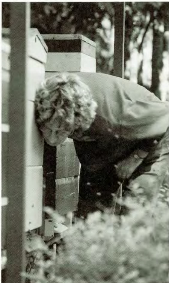
Luisteren naar tuten en kwaken.

Het tuten en kwaken van koninginnen, ter voorbereiding op het zwermen dan wel als onderdeel van het elimineren van concurrerende jonge moeren, kun je ook wel horen mét verkeerslawaaï om je heen. Met name de vrij rondlopende koningin, de tuter, laat haar aanwezigheid met energie blijken. Ze loopt over de raat, vaak in een hoog tempo, en als ze stopt drukt ze het lichaam tegen de raat en maakt het tuutgeluid, een enige malen herhaald signaal. Na het lezen van de beschrijving van Astrid ('na een aanloopje met wat kortere tonen klinkt het tuten vaak met lange en gestrekte roepen') was ik even in verwarring, in mijn herinnering was het juist andersom: in mijn herinnering bestaat de reeks uit een eerste geluidsstoot van ongeveer een seconde lang, gevolgd door een reeks kortere. In het beroemde boekwerk van Speelziek, Beetsma en vele anderen (Imkersencyclopedie voor Nederland en België) lees ik tot mijn vreugde onder het lemma Tuten en kwaken: 'De eerst uitgekomen koningin loopt over de raat, terwijl zij een helder