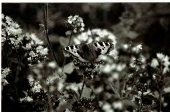
Kleine vos op wilde marjolein.

Het is ook goed mogelijk om de plant te scheuren, zowel in het voorjaar als in het najaar kan dit. Tot slot kan de plant nog gestekt worden. Dit is een