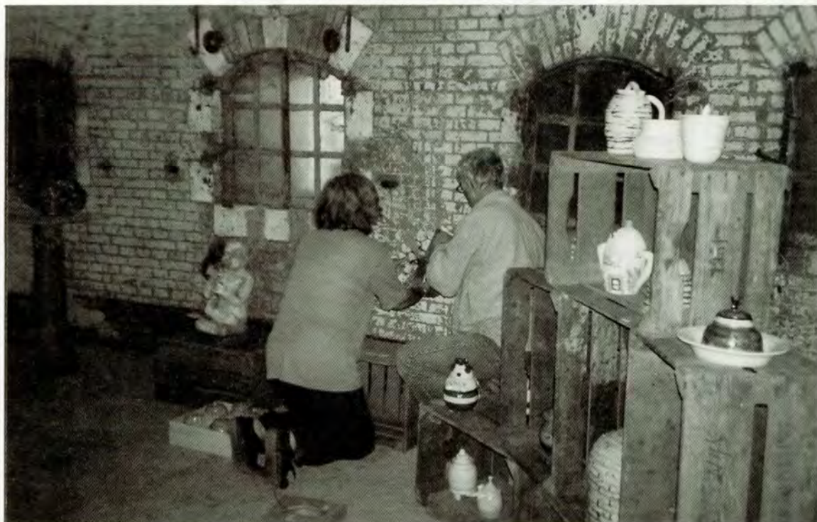
De tentoonstelling wordt ingericht.