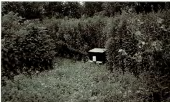
Zachtaardige bijenvolken in de bijentuin