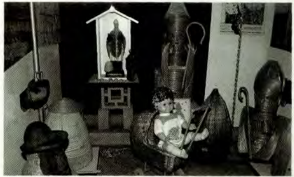
Vlechtwerk: van poppenwagen tot Ambrosiuskorf

door vastelandimkers van de lamsoordracht en vervolgens met het weghouden van de Varroa-mijt van het eiland. De maatregel heeft m.b.t. de Varroa-mijt in ieder geval geen resultaat gehad. Ook op Terschelling is de mijt de kasten binnengedrongen. Er is dus wel degelijk van illegale import sprake geweest. Maar niet door Ko Zoet.