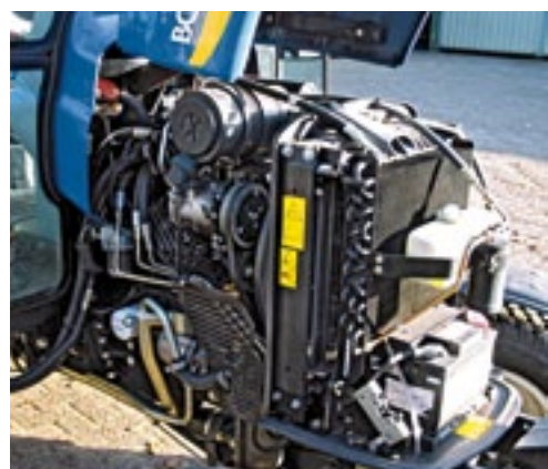
Ondanks de compacte bouw is de pittige viercilinder goed toegankelijk voor onderhoud.

De New Holland Boomer-serie is leverbaar in drie modellen: de 3040, 3045 en 3050. Die leveren een vermogen van respectievelijk 29,8/41, 33,5/46 en 37,3/51 kW/pk. Sterk genoeg dus om verschillende klussen in de groensector te kunnen klaren. Alle modellen