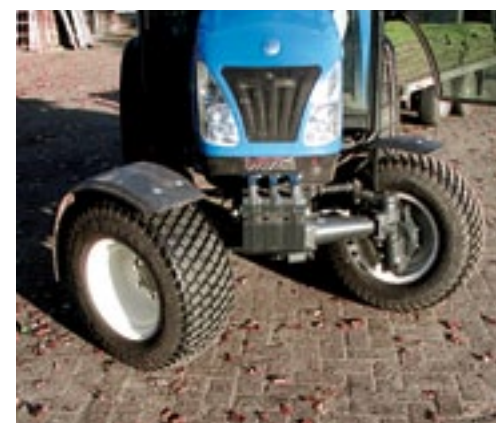
Dankzij SuperSteer hebben de wielen een maximale stuuruitslag van 75 graden.

toeren dan wanneer hij meer weerstand ondervindt. Om een bepaalde bewerking met een vooraf bepaalde vaste snelheid te kunnen verrichten, kun je gebruik maken van de cruise-control. Net als in een auto kies je met het rijpedaal de gewenste snelheid die je vervolgens 'vast' kunt zetten. Vooral op hobbelige terreinen met (steile) hellingen komt het weleens voor dat de trekker te snel naar beneden wil. De