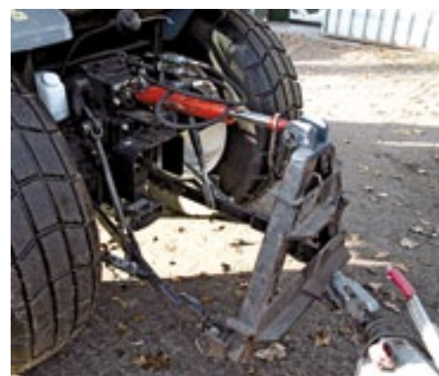
De hefinrichting tilt 1.600 kg. Standaard worden twee dubbelwerkende ventielen geleverd.

Wegrijden is simpel. Je kiest de rijrichting met de powershuttle links onder het stuur. Vervolgens druk je het rijpedaal in en regelt de trekker zelf wat hij moet doen. Rijd je onbelast, dus zonder bijvoorbeeld een zware aanhanger, dan maakt de trekker minder