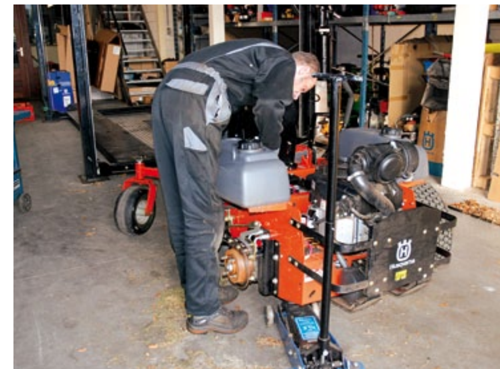
Fijngeslagen gras en blad vervuilen de zeroturnmaaier. Nu de zeroturnmaaier de winterberging ingaat, is dat een mooie gelegenheid om de maaier een volledige winterbeurt te geven.

staan. Wanneer dit niet zo is kun je dit bijstellen met de lengte van de stang die naar de stuurschuif gaat. Staan de hendels niet precies gelijk naast elkaar in de neutraalstand, dan kun je dat aanpassen middels de verstelling op de hendel. De hydraulische olie voor de aandrijving zit in een tank dichtbij de hydropomp. In de servicehandleiding van de fabrikant staat aangegeven met welk interval deze olie dient te worden verversd. Ook is het belangrijk dat de juiste hoeveelheid in het reservoir aanwezig is. Bij het rondpompen van de olie ontstaat warmte. Om de olie op de gewenste temperatuur te houden wordt die gekoeld door oliekoelers. Op de oliekoelers zit een ventilator. Door het fijne droge materiaal dat ontstaat bij het maaien, kan de oliekoeler vervuild raken. Het is dan ook belangrijk om de koeler regelmatig te controleren op vervuiling en hem schoon te maken. ■