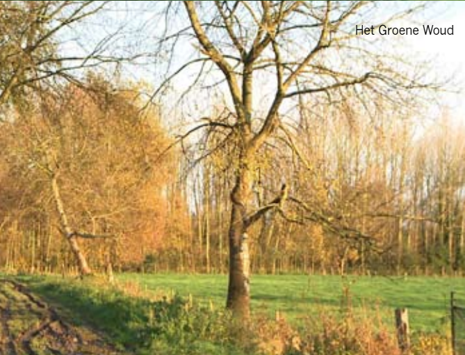
Het Groene Woud