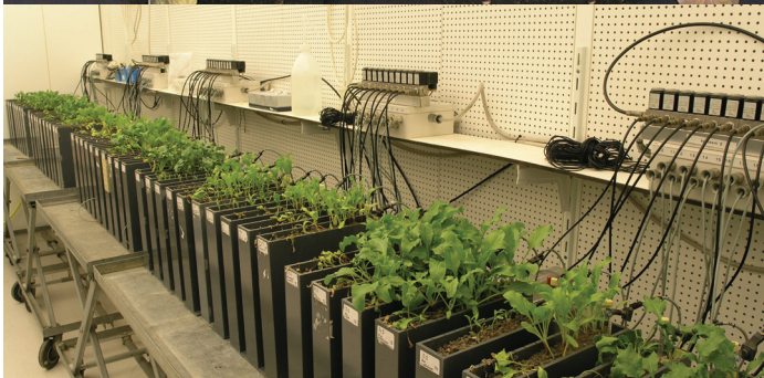
Sterke aantasting door Rhizoctonia solani (links boven) en vrijwel gezonde planten in een weerbare bodem met evenveel Rhizoctonia (rechts boven). Toetsysteem voor de bepaling van bodemweerbaarheid onder gecontroleerde omstandigheden (onder).