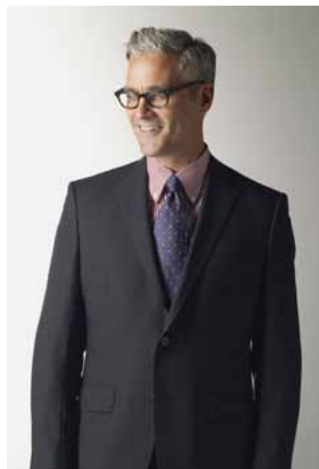
Amerikaans kostuum met nanozilver.

bijna dagelijks wetenschappelijke artikelen over zulke deeltjes. Dus is het heel relevant om ook meer te weten te komen over de gezondheidseffecten van kleine deeltjes. Wat kan wel, en waarmee loop je risico? Ik denk dat we veel plussen mogen verwachten van de nanotechnologie, en ook zeker van nanodeeltjes, maar dit is één van de potentiële minnen waar je wel oog voor moet hebben.'