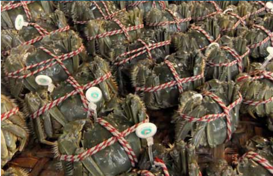
Wolhandkrabben op een Chinese markt. Nederlandse krabben bevatten teveel dioxine voor consumptie.

Het vangstverbod van wolhandkrabben dat sinds april geldt in veel Nederlandse wateren, is geen overbodige maatregel. De RIVM-RIKILT Frontoffice Voedselveiligheid heeft geconcludeerd dat door twee keer per jaar krabben uit deze gesloten wateren te eten, je al teveel giftige dioxines kunt binnenkrijgen.