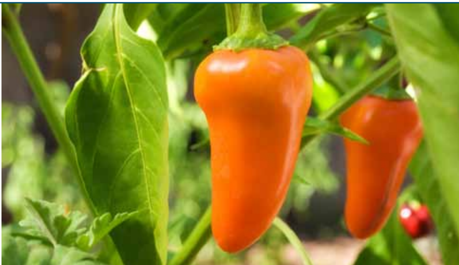
Kassen worden steeds minder mensvriendelijk. Daarom zoeken onderzoekers en bedrijven naar een robot die paprika's oogst.

'Bij hoogwaardige producten als paprika's bepaalt arbeid nu zeker een derde van de kostprijs, vooral door het handmatig oogsten', vertelt onderzoeker Erik Pekkeriet. 'In de champignonteelt is arbeid een nog grotere kostenpost. Dat maakt robots interessant. Daarnaast worden kassen voor mensen steeds minder prettig om in te werken. Door energiebesparende maatregelen stijgt zeker 's zomers de kastemperatuur, en stijgen het CO 2 -gehalte en de luchtvochtigheid. Verder verandert door gebruik van LED's voor belichting de kleur van het werklicht en neemt de plantdichtheid toe.' Voor robotmatig oogsten zijn sensoren nodig die de vruchten vinden, een robotarm die naar de vrucht toe gaat, een beoordeling van of hij mag worden geoogst, en een handje dat hem inderdaad oogst. De onderzoekers van Wageningen UR Glastuinbouw ontwikkelen software en een strategie om de sensoren toe te passen, en integreren alle noodzakelijke technieken. Door verschillen in bijvoorbeeld anatomie van een plant moet je voor ieder product en iedere variatie daarbinnen beide opnieuw ontwikkelen. 'Tomaten groeien bijvoorbeeld onderaan de plant, maar paprika's de hele plant door.' Paprika's zitten verder vaak ver-