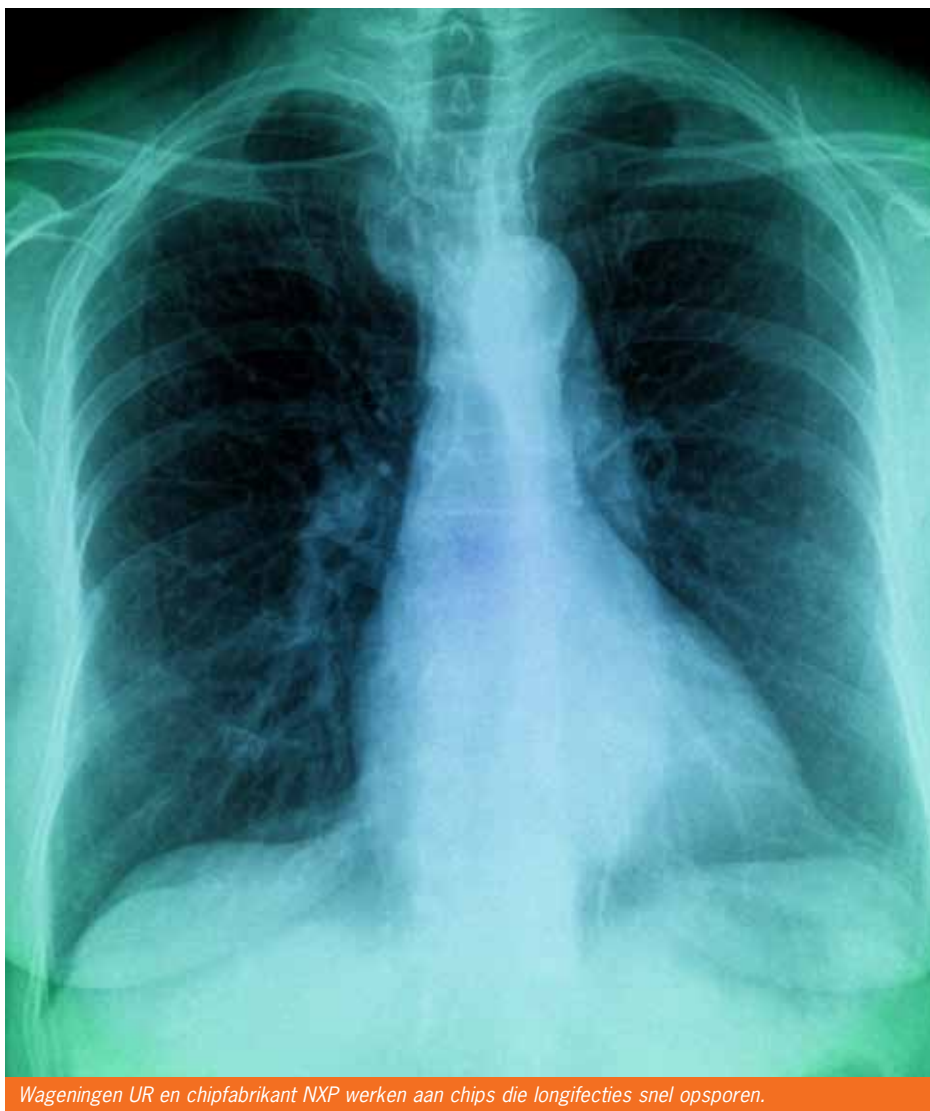
Wageningen UR en chipfabrikant NXP werken aan chips die longinfecties snel opsporen.

Het onderzoek van Zuilhof wordt gefinancierd door NanoNextNL, dat op haar beurt geld heeft ontvangen uit het Fonds Economische Structuurversterking (FES). Dat fonds gaat verdwijnen, en wordt vervangen door het topsectorenbeleid van het ministerie van Economische zaken, Landbouw & Innovatie. Hoewel het kabinet ook heeft aangegeven dat het nanotechnologie belangrijk vindt, en de