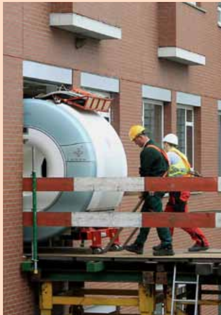
De magneet voor een nieuwe MRI-scanner wordt Ziekenhuis Gelderse Vallei ingereeden.