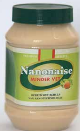
Toekomstmuziek? Mayonaise die met behulp van nanotechnologie minder vet is. (ontwerp Frans Kampers)

Collega's onderzoeken in zijn project de mogelijkheden om gezonde stoffen te verpakken in nanobolletjes, zodat ze op de goede plaats in het maagdarmkanaal vrijkomen.