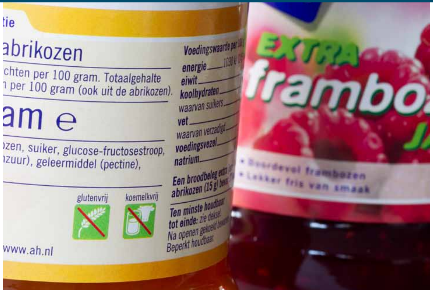
Een predictortest moet in de toekomst aangeven of een product gluten bevat of niet.