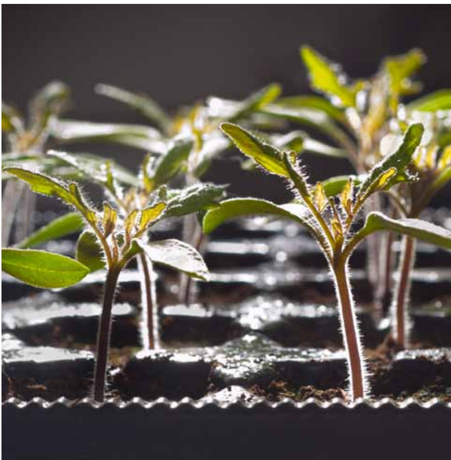
Tomatenkiemplantjes. Een machine sorteert de plantjes nu net zo snel als 27 man personeel.

De nu ontwikkelde kiemplantsoortermachine is een spin-off van het MARVIN-project dat startte in 2008, met een consortium van brancheorganisatie Plantum en dertien bedrijven, en financiering vanuit het ministerie van EL&I, Productschap Tuinbouw. Meedoen in het project gaf bedrijven twee jaar voor-sprong op concurrenten.