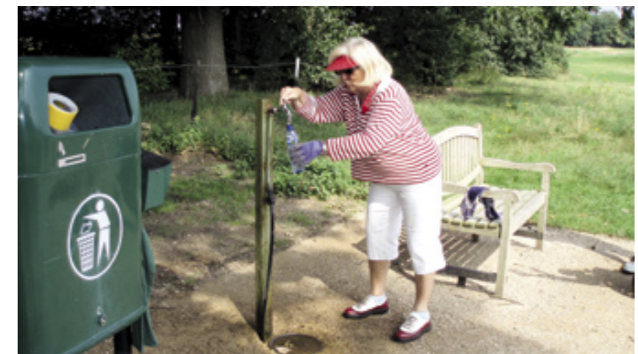
Ook op de servicepunten is een stabiele toplaag met Stabicol aangebracht.

Stabicol CE met een natuursteengranulaat, krijg je een stabiele toplaag met asfaltachtige eigenschappen en een natuurlijke uitstraling. Zowel de baancommissie als de clubleden zijn na twee maanden gebruik zeer enthousiast. De paden passen goed in de natuurlijke omgeving en de jaarlijks terugkerende problemen zijn opgelost. De leden prijzen het gebruiksgemak.