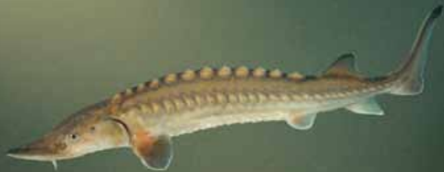
Atlantische steur. Volwassen dieren leven in zee, maar trekken in het voorjaar de rivieren op om te paaien