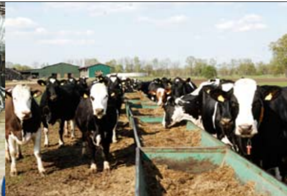
De droge koeien verblijven in een grote uitloop. Het melkvee heeft veel frisse lucht in de hoge, open ligboxenstal