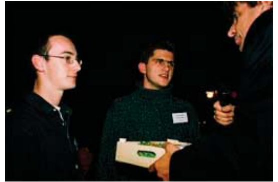
Winnaars van de MBO-essaywedstrijd ontvangen van de minister hun prijs

De jury bestond uit een vertegenwoordiger van de Rabobank, Vakblad Groen Onderwijs en NAJK. Het winnende essay verscheen op 11 november in het Agrarisch Dagblad.