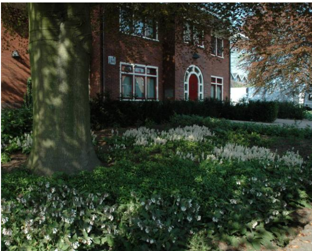
Vooral onder grote bomen zijn de groeiomstandigheden voor onderbeplanting lastig.

Het belangrijkste doel is om de mogelijkheden en eisen van boomspiegelbeplanting in kaart te brengen en om een betrouwbaar sortiment te adviseren en te promoten. Middels een grondig literatuuronderzoek, observaties van beplantingen op diverse praktijklocaties en proeven in de sortimentstuin in Boskoop is veel kennis verzameld.