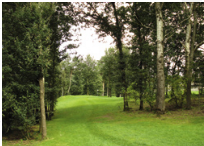
Het moeilijkste deel van de baan door de boog van bomen.