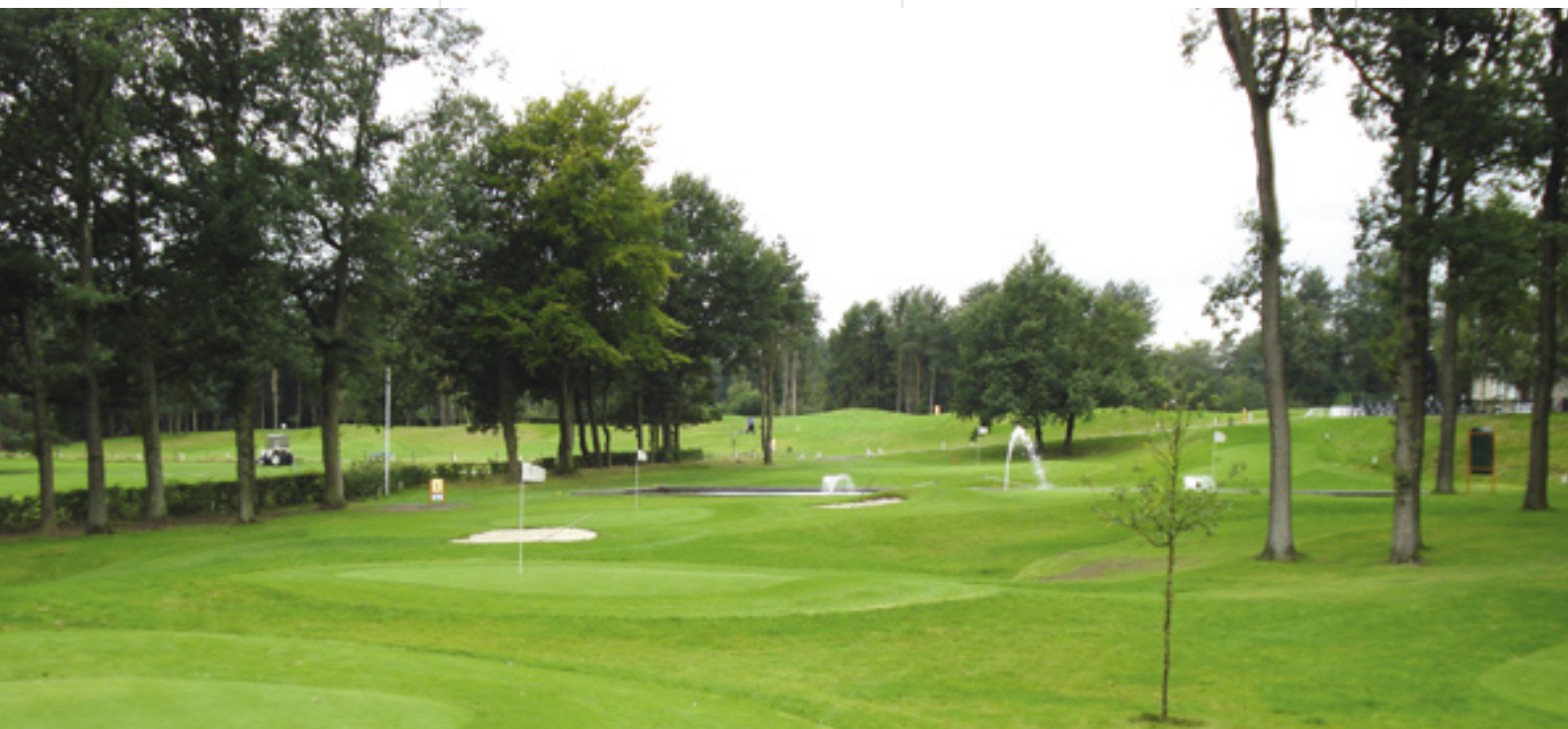
De baan met de voor de golfbaan zo bekende vijver.