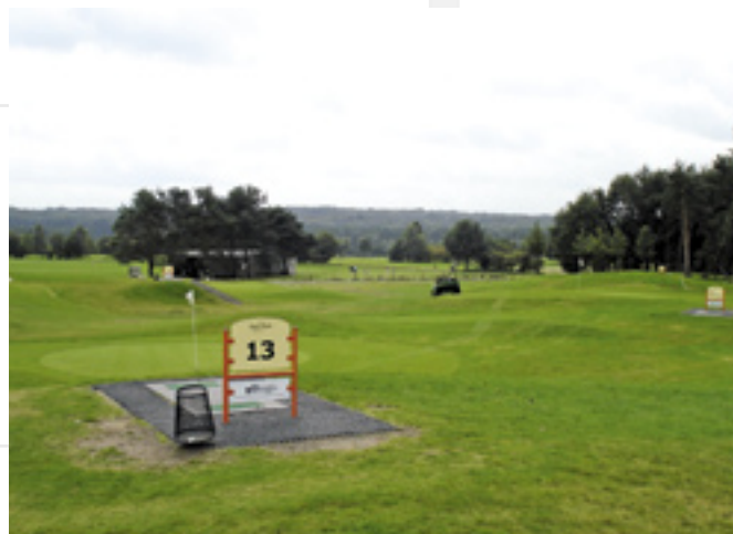
Vaste afslagplaatsen op de baan.

Wat voor manager ben je en aan wie draag je verantwoording af?