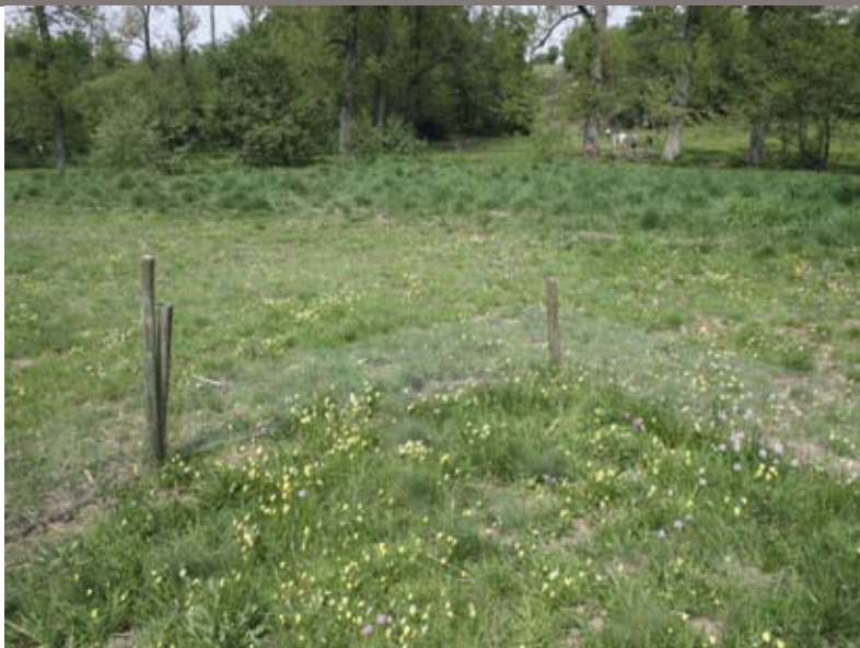
1 Indruk van zinkflora in april 2011. Zichtbaar is de afrastering van een van de plots aangelegd in april 2006 met daarachter één van de in mei 2008 uitgebreide terreindelen.