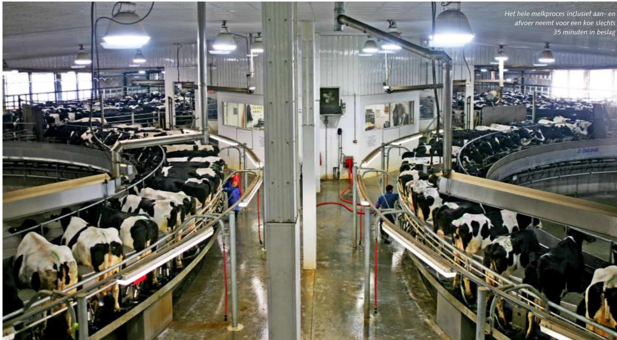
Het hele melkproces inclusief aan- en afvoer neemt voor een koe slechts 35 minuten in beslag

Bij het oprijden van het terrein van Rosendale Dairy in het gelijknamige Rosendale is er geen koe te bekennen. Pas als we van de grote parkeerplaats richting de ingang rijden, zien we dat hier melkveehouderij wordt bedreven. Maar liefst twaalf glimmende melktanks steken – op de voor de Verenigde Staten typerende manier – half uit het gebouw. Elke twee uur zorgen de 8000 koeien en 75 medewerkers ervoor dat er eentje vol komt.