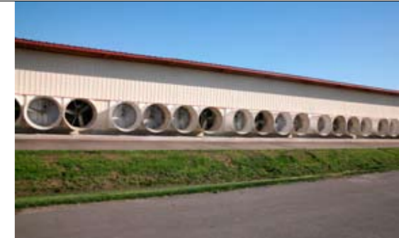
Door mechanische ventilatie minder hittestress en dus een hogere productie

Rosendale heeft veel tegengas gekregen van kritische organisaties vanwege de grote omvang. Daarom is er extra aandacht besteed aan het milieu en het uiterlijk van het bedrijf: overal is het superschoon. Achter de stal wordt de mest onder dak met grote scheidingsapparatuur gescheiden van het zand door middel van wassen en daarna verder ingedikt.