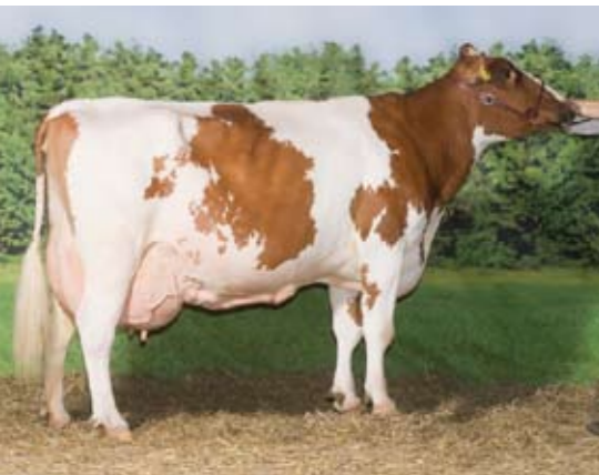
Barendonk Wilma 183 (v. Kian), seniorkampioene roodbont Prod.: 4.07 335 14.399 4,10 3,45 lw 113