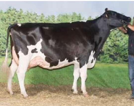
Cynthia (v. Red Marker), kampioene middenklasse zwartbont Prod.: 4.00 99 3496 3,74 3,48 lw 98 l.l.