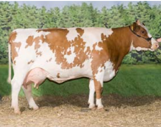
De Vinkenhof Daniëlle 51 (v. Dorus), seniorkampioene mrij Prod.: 4.03 320 10.064 4,28 3,75 lw 122