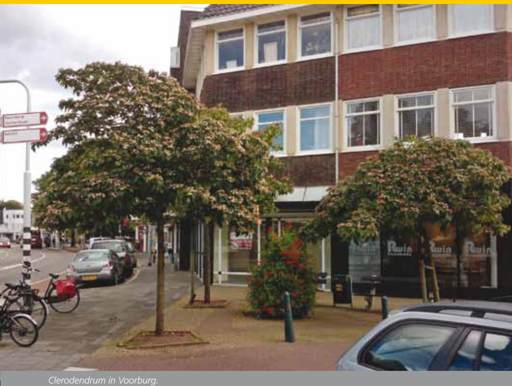
Clerodendrum in Voorburg.

Zo wordt de benodigde bewortelbare ruimte niet alleen aangegeven in kubieke meters, maar tevens in het aantal vierkante meters; gemak dient de mens. Hierdoor worden de betrokken partijen direct met de neus op de feiten gedrukt, zoals wanneer er sprake is van een hoge grondwaterspiegel, dan is het nodig om het aantal vierkante meters bewortelbare ruimte te verhogen en heeft deze bijvoorbeeld de afmeting van drie parkeerplaatsen. Iedereen kan zich dan meteen afvragen of deze ruimte gemist kan worden of er überhaupt is. De berekende toetsnormen worden op drie toetsniveaus weergegeven, namelijk 'optimaal', 'redelijk' en 'marginaal'. Ontwerpen die (deels) niet voldoen aan de marginale toetseisen, moeten op dat punt worden bijgesteld of afgewezen worden. De boombeheerder heeft richting de ontwerper op deze manier een heel eenvoudig en duidelijk toetsmiddel in handen. Door in het programma bij de leeftijd van de boom te kijken, kan ook voor een bestaande situatie worden uitgelezen welke toetsnormen voor de boom nodig zijn of moeten worden