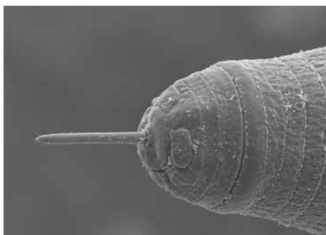
A-biotische stressfactor- virussen: Nematoden.

De stimulanten van de natuurlijke afweer (SNA) zijn daarentegen producten die direct werken op de natuurlijke verdedigingssystemen van de plant. De SNA's die een directe uitwerking hebben kunnen bestaan uit hormonen, in het bijzonder auxines (hormonen die plantengroei door celstrekking reguleren en die in bijna alle hogere planten vele en zeer verschillende andere functies hebben), maar ook aminozuren zoals glutaminezuur. Gedurende de afgelopen vijftien jaar heeft men ook veel energie gestoken in de ontwikkeling van stimulanten van plantensuikers. De complexe suikers hebben de eigenschap dat ze aanvallen van ziekteverwekkers kunnen simuleren, zodat de natuurlijke afweersystemen van de plant op een voor de plant veilige manier worden geactiveerd.