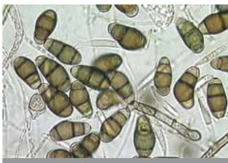
A-biotische stressfactor- virussen: Schimmels.