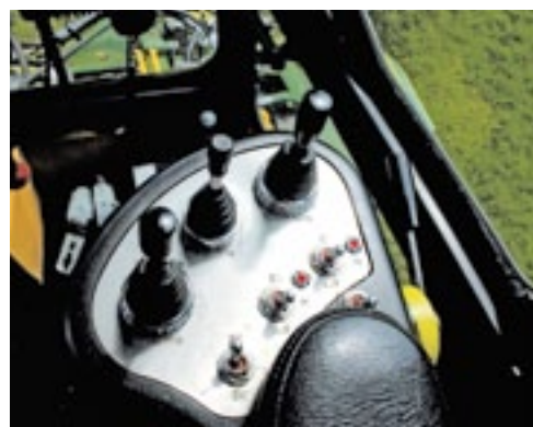
■ Drie joysticks in de leuning zorgen voor een comfortabele bediening van het maaidek.