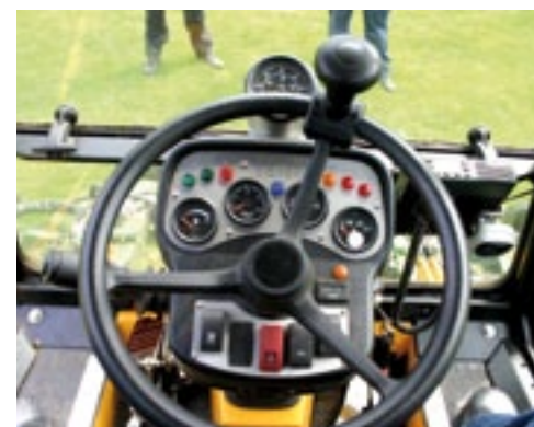
■ De rijpedalen aan de rechterkant van de stuurkolom.