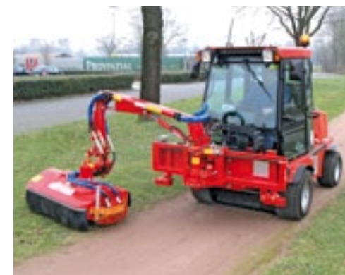
■ De Schell SG 100 is voor meerdere doeleinden geschikt en dus echt multifunctioneel.