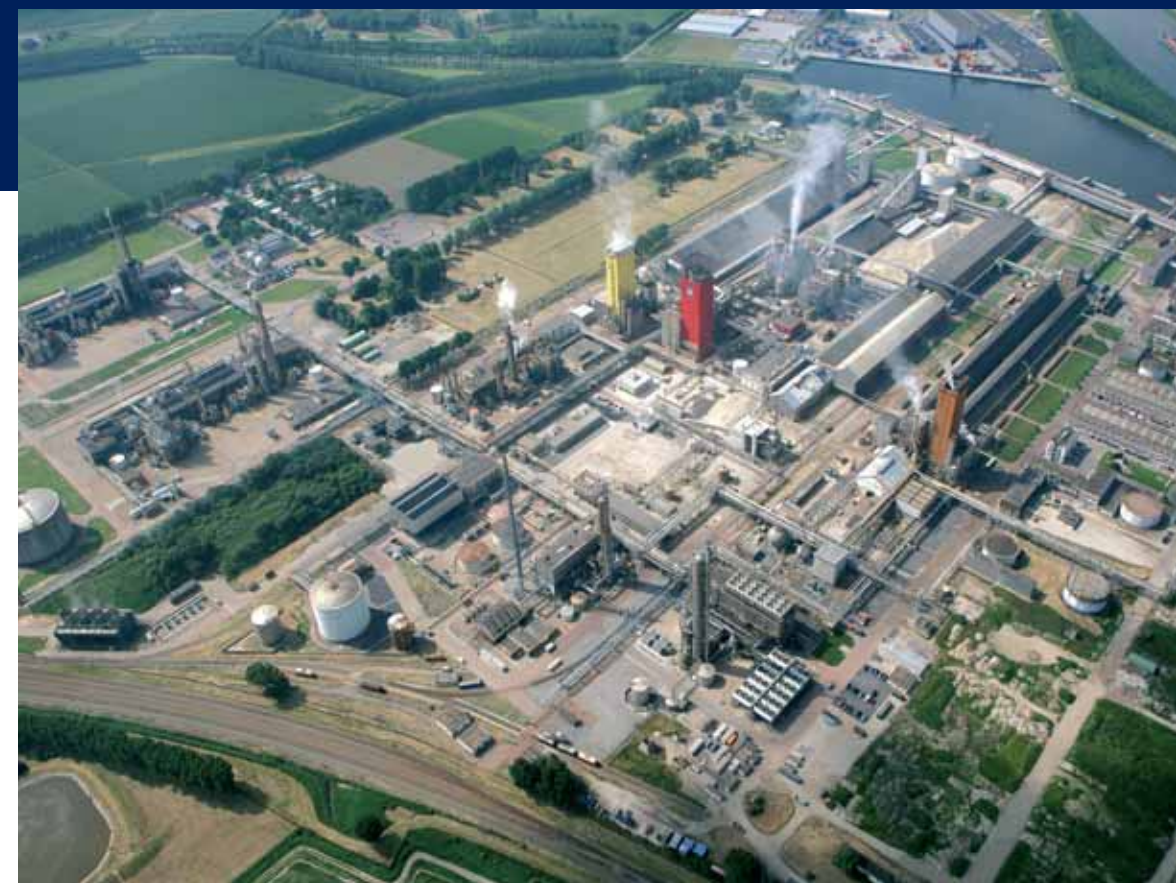
De kunstmestfabriek Yara zit al jaren in de Kanaalzone, maar vormt straks onderdeel van het agrarisch-industriële cluster van Biopark Terneuzen.

Verder komt er een belangrijke koppeling tussen het glastuinbouwcomplex en de biomassavergister. Straks verwerkt de Biomassa Unie niet alleen de biomassa uit de regio en enorme hoeveelheden biomassa van elders uit de wereld, maar ook biomassa-afval uit het glastuinbouwgebied. Ook de nieuwe bio-ethanolabriek van Nedalco en de biodieselabriek van Rosendaal Energy