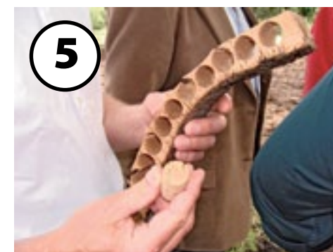
Foto 5 Siebo Foreman vertrok 25 jaar geleden vanuit Groningen naar Portugal. Eerst als werknemer bij verschillende boeren en nu heeft hij samen met zijn vrouw Catarina een zoekkoeienbedrijf met kurkbomen en een camping in Evoramonte. De kurkteelt is zeer specifiek, oogsten kan pas vijftig jaar na planten en dan elke negen jaar. De opbrengst is nu nog maar 1,5 euro

Foto 4 Olaf Maat, de zoon van Jan Maat, is in 1986 naar Portugal vertrokken om in Redondo ongeveer 85 melkkoeien op 106 hectare te houden. Het bedrijf is inmiddels 400 hectare groot, waarvan 5 hectare wijnbouw, en telt 400 melkkoeien met bijbehorend jongvee. Olaf runt het bedrijf samen met zeven vaste medewerkers en op de piekmomenten helpen jongeren uit de buurt. Goed personeel krijgen is een van de moeilijkheden in Portugal. Het land kent hete zomers en daarom ligt er zand in de ligboxen. Er zijn geen mestkelders, al het vocht verdamppt. De mest wordt in een opvangvat geschoven en veelal bovengronds uitgereden, omdat de grond te hard is voor zodebemesting. De melkprijs is relatief laag en hierdoor is het niet mogelijk om luxe stallen te bouwen. Vergunningen van plaatselijke overheden zijn eenvoudig te verkrijgen en worden niet gecontroleerd. Adviseurs en voerlichters zijn er weinig en komen zeker niet uit zichzelf op het bedrijf. Goede dierenartsen zijn schaars, waardoor veel kosten voor medicijnen gemaakt worden.