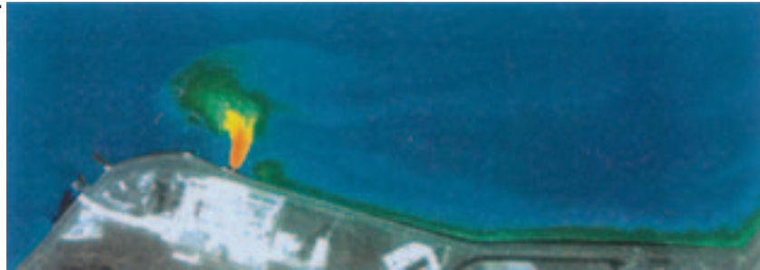
..... Figuur 4.2: Warmtelozingsbeeld Eemscentrale bij hoog water (Fraikin & van den Bergs, 1996). In de pluim met het groene, gele en rode gebied is het water meer dan 2 graden warmer dan het water in het estuarium.

In de zomermaanden neemt het oppervlaktewater van kustwateren en estuaria hoge temperaturen aan. Temperaturen tot 24 á 25 °C zijn in het Eems-estuarium en de Westerschelde gemeten. Dit komt door de geringe gemiddelde waterdiepte en het tweemaal daags droogvallen van de getijdenplaten die door hun donkere kleur als zonnecollectoren fungeren. Vissen die bij deze temperaturen niet kunnen overleven zijn dan niet meer in het estuarium aanwezig.