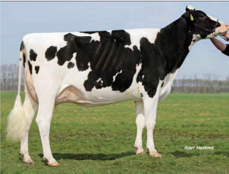
Veenh. Damion Winnie, prod.: 2.11 305 10.446 4,43 3,62 lw 138