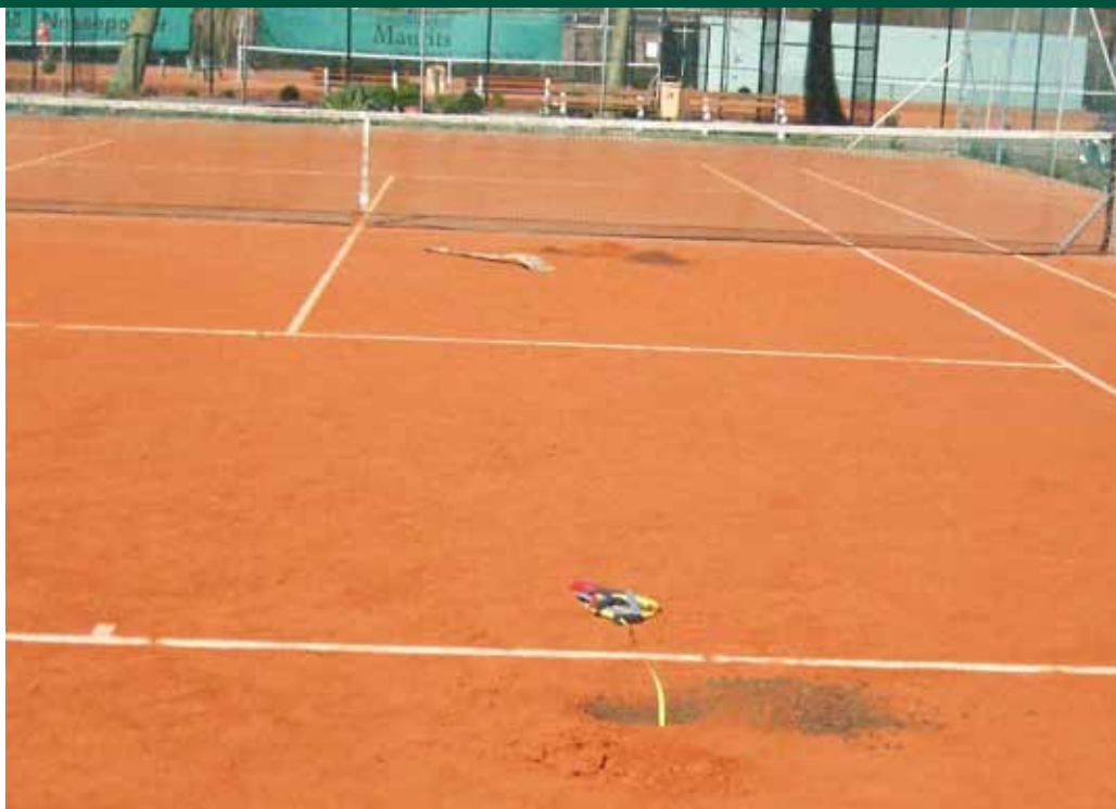
Het meten van de gravellaag. Deze behoort 3 centimeter te zijn.