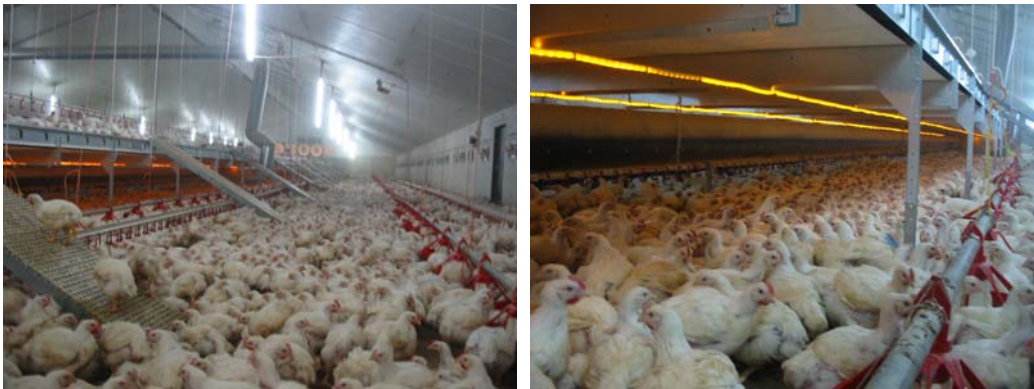
Figuur 2 Extra leefvloer zoals geïnstalleerd bij Mts. Nijkamp te Raalte. Via oploopp planken konden de kuikens de stelling bereiken (links). Onder de stelling was een beluchtingbuis, welke was aangesloten op de warmtewisselaar, en een lichtslang aangebracht (rechts)

De vleeskuikenhouder uit Raalte zou graag de toepassing van een verhoogd plateau in de vleeskuikenhoudery verder willen doorontwikkelen. Hij zou graag het plateau willen voorzien van een (flexibele) kunststof (rooster)vloer. Echter de huidige regelgeving schrijft voor dat een vloer voorzien dient te zijn van strooisel om mee te tellen als beschikbaar oppervlakte, terwijl het gebruik van de kunststof roostervloer ook bepaalde voordelen kan opleveren, niet alleen vanuit het dierenwelzijnopunt, maar ook vanuit milieuopunt.