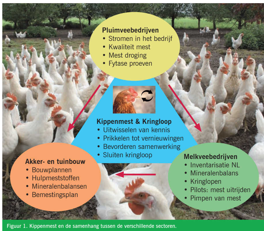
Figuur 1. Kippenmest en de samenhang tussen de verschillende sectoren.

Pluimveemest is een hoogwaardige meststof met veel stikstof, fosfaat en kali. De hoge fosfaatwaarden maken de afzet echter moeilijk. Akkerbouwers kunnen een beperkte hoeveelheid fosfaat per hectare uit dierlijke mest per jaar op hun land brengen. Pluimveemest bevat vaak evenveel stikstof als fosfaat. Door de fosfaatbeperking kan met deze mest dan vaak niet genoeg stikstof op het land kan worden gebracht. Het project 'Kippenmest & Kringloop' was vooral bedoeld om te onderzoeken hoe de stikstof-fosfaat verhouding kan worden aangepast, zodat deze mest beter bruikbaar is voor de teelt van gewassen. In dit BioKennisbericht vindt u informatie over de verschillende mogelijkheden.