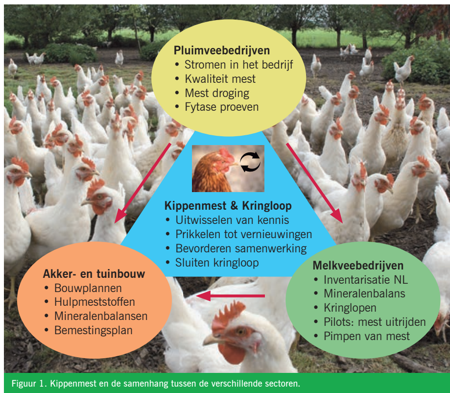
Figuur 1. Kippenmest en de samenhang tussen de verschillende sectoren.

Pluimveemest is een hoogwaardige meststof met veel stikstof, fosfaat en kali. De hoge fosfaatwaarden maken de afzet echter moeilijk. Akkerbouwers kunnen een beperkte hoeveelheid fosfaat per hectare uit dierlijke mest per jaar op hun land brengen. Pluimveemest bevat vaak evenveel stikstof als fosfaat. Door de fosfaatbeperking kan met deze mest dan vaak niet genoeg stikstof op het land kan worden gebracht. Het project 'Kippenmest & Kringloop' was vooral bedoeld om te onderzoeken hoe de stikstof-fosfaat verhouding kan worden aangepast, zodat deze mest beter bruikbaar is voor de teelt van gewassen. In dit BioKennisbericht vindt u informatie over de verschillende mogelijkheden.