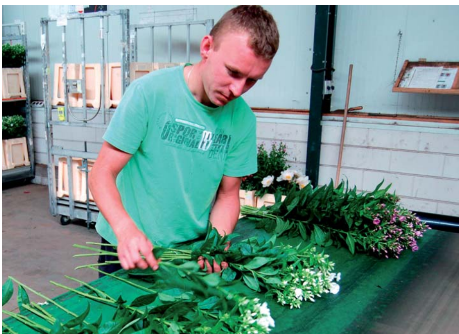
Het klaarmaken voor de veiling