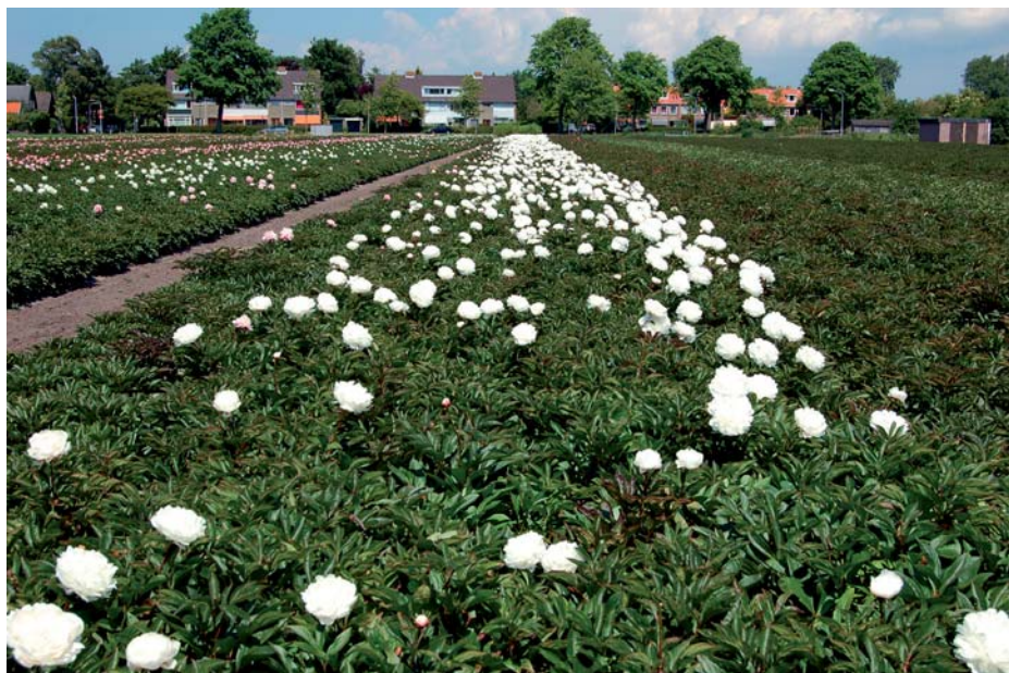
Niet voor de snij, wel voor de tuin: pioenen van Chinese herkomst

Hun totale Phloxen-sortiment omvat een oppervlakte van 4 hectare moederplanten met zo'n 20-25 soorten. Die zouden allemaal wel gesneden kunnen worden, maar Verschoor beperkt zich tot een drietal langere cultivars, te weten 'Daniëlle', 'Fondant Fancy' en 'Blue Paradise' (geen eigen soort). Jaarlijks veilen ze zo'n 800.000 bloemen. Ze zijn maandag 28 juni begonnen aan de buiten-Phloxen. De kas-Phloxen brachten dit jaar goed geld op, gemid-