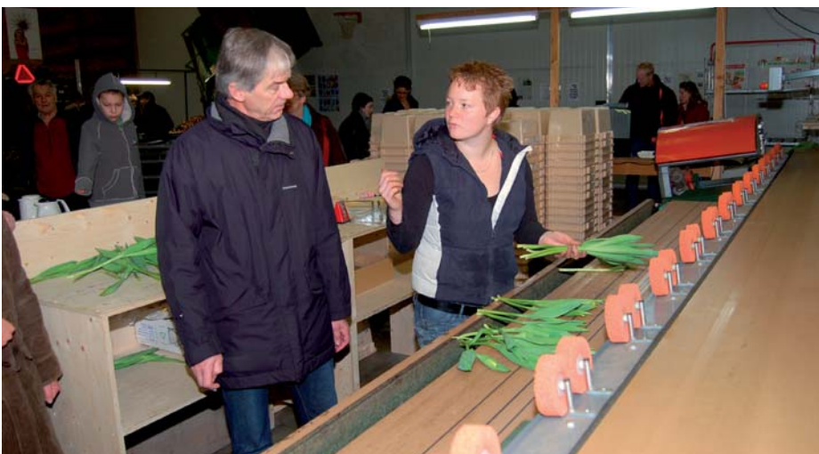
Uitleg tijdens de open dagen aan een bezoeker