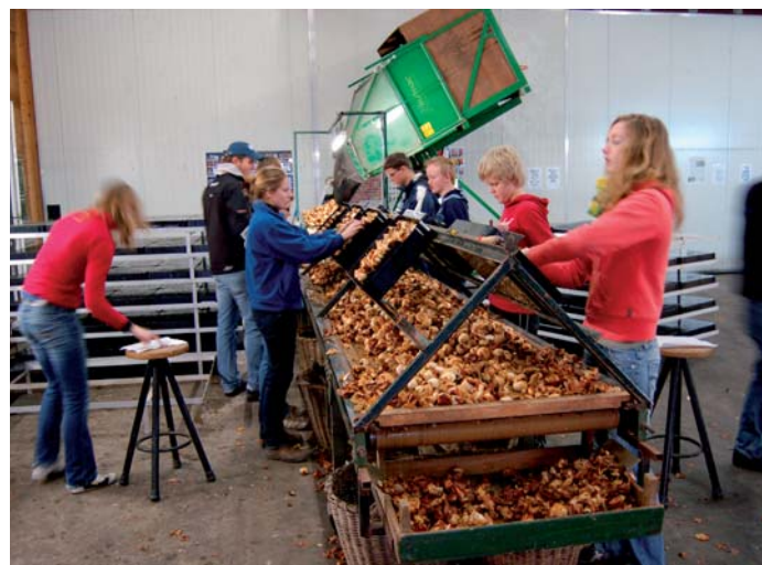
Het opplanten van de bollen