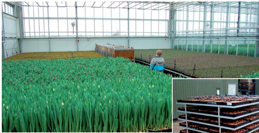
Het Easy Carriers systeem van Smit Constructie: optimale benutting kasruimte

Er is de afgelopen jaren veel geïnvesteerd in sortimentsvernieuwing. Nu gaat dat even op een wat lager pitje. "We zitten al hoog in het sortiment. En de verdiensten zijn minder". De rode darwinhybride 'Trick' is een van de nieuwe soorten, waar de komende jaren het een en ander van verwacht wordt. Vorig jaar bracht een proefje van 5000 bloemen 42 cent per steel op, reden om dit jaar een groter aantal te broeien: vanaf week 7 zo'n 100 000 in totaal. "'Trick' geeft een zware bos, daar zijn vooral de Russen gek op". Of de prijs dan weer tot zulke hoogten zal stijgen, is natuurlijk mede afhankelijk van de algehele marktsituatie. En die was, zoals iedereen weet, tot 22 januari ronduit slecht. Sinds een week of twee – we bezoeken Mts Mellema-Versteeg tijdens de open dagen ter gelegenheid van de Creiler Flora begin februari - komen er weer wat positievere berichten van het prijzenfront. Met ruwweg eenderde van de bloemen weg zit Mellema-Versteeg op een middenprijs voor zijn sortiment van 13,2 cent. De afgelopen twee weken lag de middenprijs op 17-18 cent. "Als we die prijs kunnen houden tot eind april komen we gemiddeld uit op 15,5-16 cent. Dat is ongeveer onze kostprijs en altijd nog lager dan de middenprijs van afgelopen paar jaar die op 18 cent lag". In deze prijssituatie is het gunstig dat er weinig uitval is. De kwaliteit is goed, al zijn er nu het warmer wordt wel wat meer zwe-