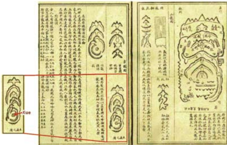
Figuur 2 Pagina uit 19e eeuws K'an-yü boek. Te zien zijn diagrammen van bergsystemen. De kleine rondjes op bepaalde plaatsen zijn de Xue of 'krachtplaatsen'.

Landschapsvormen worden in de Chinese traditie in verband gebracht met verschillende vormen van energie. Zo zijn bergen vooral geassocieerd met spirituele energie en rivieren meer met wereldlijke- en financiële energie. Veel culturen kennen dergelijke typering van hun landschappen en hoe ze op passende wijze te benaderen en gebruiken. Daarnaast hebben niet alle landschapsvormen hetzelfde karakter: sommigen zijn helend en vriendelijk, andere ongenaakbaar, toornig of zelfs kwaadaardig. Verder verschillen ze in kracht: de Chinese traditie wijst zogenaamde Xue of 'krachtplaatsen' aan, waar gebruik kan worden gemaakt van de energie van het land. Ze worden op dezelfde manier benoemd en beschouwd als de acupunctuurpunten op het menselijk lichaam. Op dezelfde wijze als een acupuncturist een naald plaatst voor medisch gebruik, bouwt de K'an-yü expert een pagode.