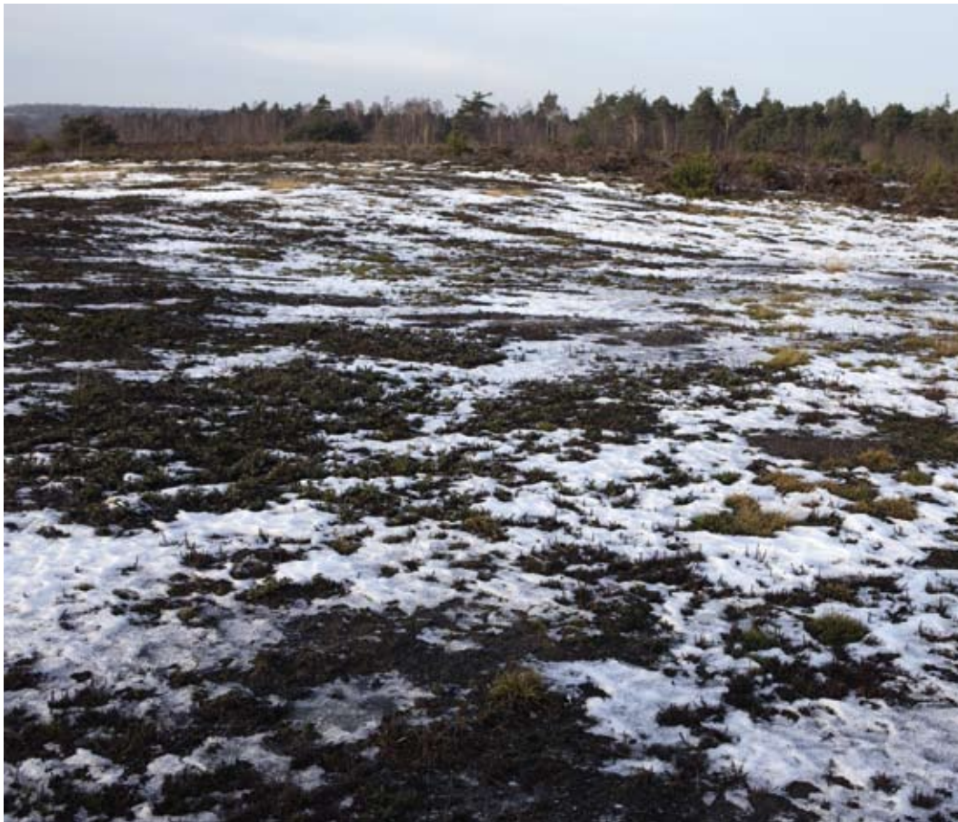
Enkele jaren geleden afgeplagde heide.

Volgens de deskundigen hebben maatregelen voor de duurzame instandhouding het korhoen alleen zin als we in staat zijn op de middellange termijn de heuvelrug te verbinden met de omgeving, zegt Roos. Voor het complete biotoop zijn namelijk ook de flanken van belang, hier moeten de vogels op natte heide en akkertjes