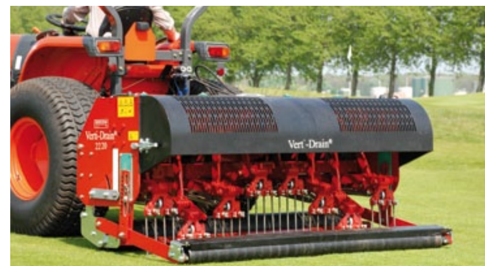
De Verti-Drain Concorde 122.020 is een nieuwe, snelle penbeluchter. Hij prikt gaatjes tot 22,5 cm diep op hoge snelheid. De aandrijving gebeurt via een tandwielkast in het midden. Aan de rechte drijfstanden kunnen pennen van 12,5 tot 24 mm. Eenvoudige schokdempers brengen de pennen na prikken in de juiste positie terug. De centrale hoekverstelling is met bouten vast te zetten. Standaard is hydraulische diepteverstelling met een aanwijzer die je vanaf de trekker kunt zien. Achterop zit een zware rol. De Concorde weegt 1.050 kg, werkt 208 cm breed en kost 27.050 euro exclusief btw.