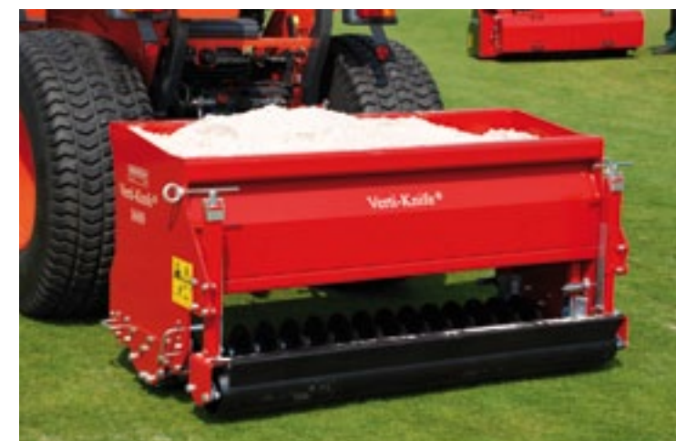
De Verti-Knife 1600 is een slitter met vaste, grondaangedreven messen. Standaard zijn twee mesrollen die 5 cm diep gaan op 5 cm afstand. Haal je een rol weg, dan is de afstand 10 cm. Optioneel is een rol die 15 cm diep gaat met 26 cm rijafstand. Voor tegengewicht kan er in de bak 1.000 kg zand of grindzakken. De Verti-Knife 1600 is te koop voor 5.060 euro.