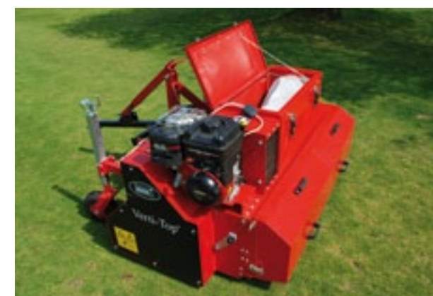
Ook stond er een nieuwe toplaagreiner voor kunstgras, de Verti Top Pulled. Die heeft een eigen 6,5 pk B&S motor waardoor je hem kunt trekken achter een klein trekkertje of transporter. Hij werkt 150 cm breed en kost 15.405 euro.