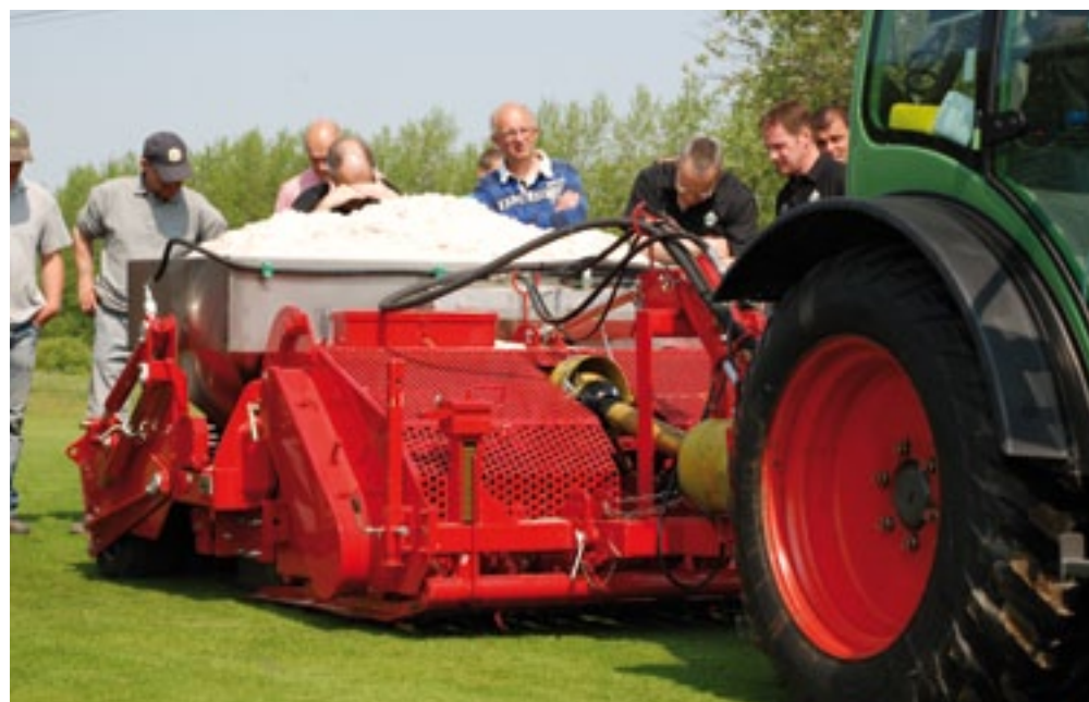
De Vibra Sandmaster drainmachine bestaat uit een schudfrees met een trillende zandbak om de sleuven te vullen met zand. Dit kan tot 17 cm diep. Zowel de frees als de trillende bak voor 1 kuub zand wordt mechanisch aangedreven. De rest, zoals heffen en de schuif van de bak opentrekken, gaat hydraulisch. Op het droge proefveld werden de sleuven goed tot 15 cm diep met zand gevuld. Wel ontstonden er opstaande randen naast de sleuven die je dan vlak moet rollen. Overigens waren er later bij een betere afstelling haast geen oneffenheden. Achterop zit een hele rij wielen om het gewicht van de machine te dragen. De Sandmaster kan 12 tot 15 kuub zand per 1.000 m 2 zand in sleuven brengen. Hij werkt 150 cm breed met sleuven op 26 cm afstand en kost 48.980 euro.

Voor 2011 heeft Redexim diverse nieuwe machines voor sportveld- en golfbaanonderhoud. Op 20 april demonstreerde Gebr. Bonenkamp uit IJsselstein alle nieuwe machines op de golfbaan van golfvereniging Reymerswael in Rilland-Bath (Zeeland). Van de Concorde snelle Verti-Drain, driepunts verticuteerder en Vibra Sandmaster drainmachine tot de verbeterde Rink strooiers.