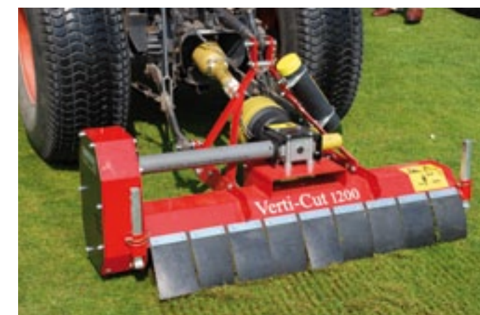
De Verti Cut 1200 is een verticuteerder voor in de driepunt. De diepte, tot 30 mm, regel je via de topstang. De messen staan op 3 cm afstand en hebben 2 of 3 mm brede punten. Via een stevige middenas gaat de aandrijving van de messen via een V-snaar. De Verti Cut 1200 kost 4.225 euro.