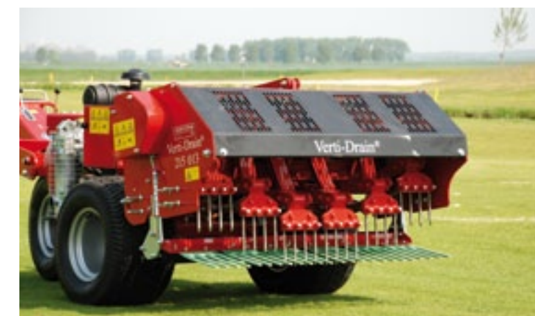
Aan de nieuwe Carrier Tool, zie aprilnummer, demonstreerde Bonenkamp de Verti Drain 215.013 penbeluchter. Dit werktuig kan ook aan een compact-trekker. Hij werkt 132 cm breed, tot 15 cm diep en kost 11.220 euro.