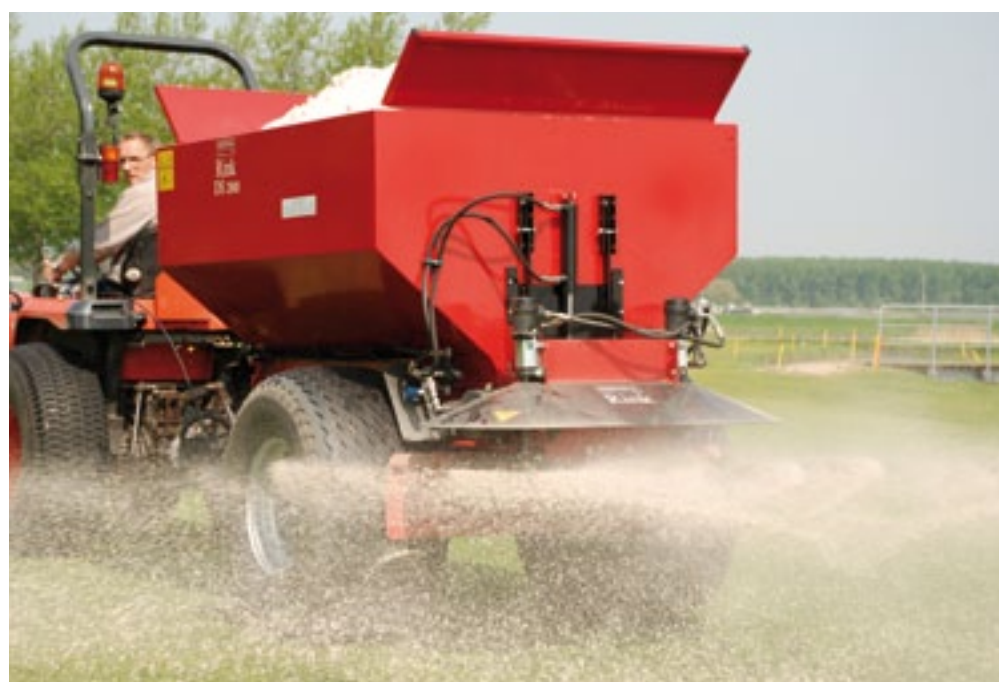
De Rink strooiers zijn verbeterd en uitgebreid met de getrokken DS2000 schoteldresser. In deze topdresser kan 2 kuub zand. Hij is hydraulisch te verstellen. De machine heeft hiervoor een eigen hydraulisch systeem, aangedreven door de trekkeraftakas. Hij heeft twee schotels die tegen elkaar in draaien. Die kun je, net als de bandsnelheid, via regelaars verstellen. Dit kan optioneel elektrisch vanaf de trekker. De Rink 2000 kost 14.700 euro.