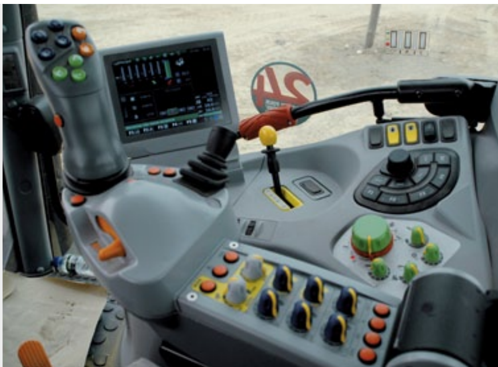
De vertrouwde hendel voor de bediening van onder andere cvt, hydrauliek en hef met het nieuwe beeldscherm van de iMonitor. Met het bedieningspaneel rechts bedien je de functies van de monitor.