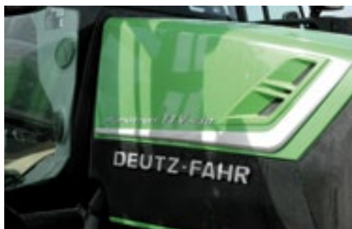
Onmiskenbare familietrekken, maar toch net iets sprekender door een andere 'oogopslag'.