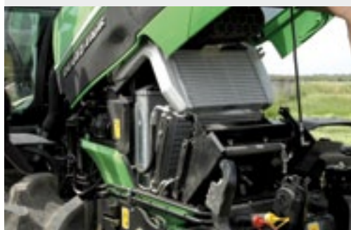
Het pakket koelers is goed bereikbaar doordat het vergaand uitklapbaar is.