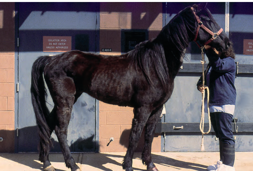
Paard met chronische EIA-infectie

EIA of moeraskoorts is de laatste tijd veel in het nieuws. Tijd om de feiten over deze aandoening, waarvan een besmet paard levenslang drager blijft, op een rij te zetten.