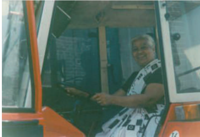
Afb. 2. Internationale contacten en uitwisselingsprogramma's met boerinnen uit landen zoals India en Brazilië.

mijn geloof. Ik kan het niet en wil het niet. Ik wil niet worden uitgebuit en ik wil anderen niet uitbuiten. Ik wil gewoon de kost verdienen.” De wens om voor een betere wereld te strijden was soms pijnlijk en bracht hen in een persoonlijk dilemma. Waar was die andere wereld waarin boeren en boerinnen willen leven en hoe zag die er dan uit? LBB-vrouw Miny Wolterink-Ten Den verwoordde dit in het gedicht ‘Een wereld waarin boerinnen willen wonen’. Zij schreef het voor een lezing te Deventer in juni 1987 en liet zich daarbij inspireren door het bekende gedicht ‘Er is een land waar vrouwen willen wonen’ van de feministe Joke Smit.