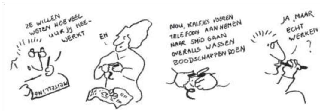
Afb. 6 en 7. Werk voor en achter moeilijk te scheiden, uit: AAW voor boerinnen en tuindersvrouwen, 1986.