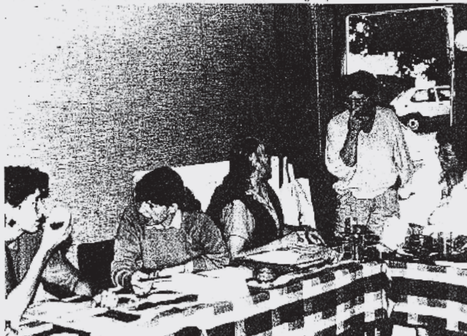
Een bijeenkomst van de Landelijke Boerinnenbelangen

Ida: 'Deze groep laat een boerinnengeluid