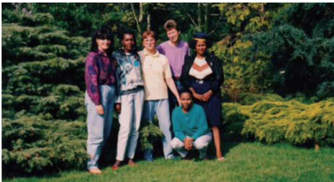
Afb. 1. Internationale contacten en uitwisselingsprogramma's met boerinnen uit landen zoals India en Brazilië.