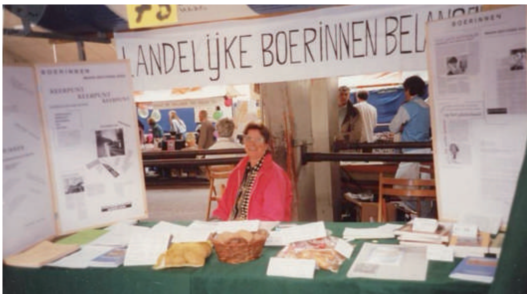
Afb. 8. LBB-stand.