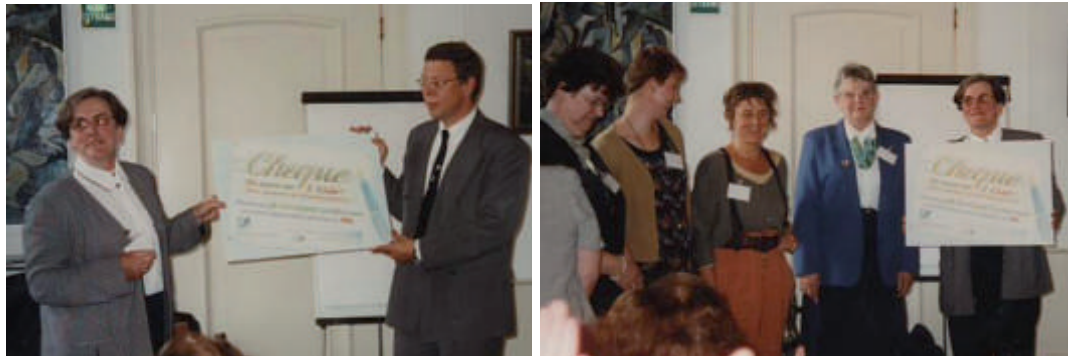
Afb. 4 en 5. In 1997 ontvangt LBB samen met vijf andere vrouwenorganisaties de LNV-emancipatieprijs voor het projectvoorstel 'Agrarische vrouwen en herstructurering in de intensieve veehouderij'.

bedrijfsvoering. Ook pleitten zij voor bescherming van de privacy van het gezin en het privékapitaal. Het mogelijk faillissement van het bedrijf betekende namelijk dat alles, ook wat het gezin aanging en wat het aan bezittingen voor het gezin had, als onlosmakelijk deel van het gezinsbedrijf in de vereffeningen van uitstaande schulden werd betrokken. Kortom, een rechtvaardige verdeling van posities en zeggenschap tussen mannen en vrouwen in agrarische gezinsbedrijven was ingewikkeld en lastig om te realiseren, juist omdat gezin en bedrijf van oudsher economisch en juridisch sterk verbonden waren.