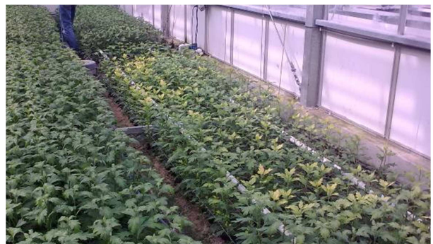
Figuur 3. fytotoxiciteit op zandbed