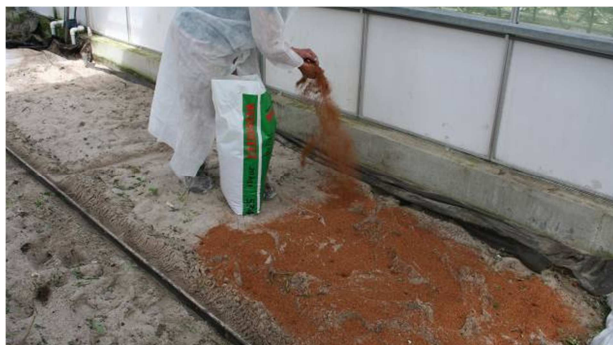
Figuur 1. Dosereren van herbie 7022

Als onderdeel van een proef voor alternatieve substraten voor de teelt van chrysant zijn verschillende ontsmettingsmethoden tegen ziekten en plagen getoetst. Eén van de gebruikte methoden is biologische grondontsmetting. Bij deze methode wordt een organisch materiaal (Herbie 7022) onder gespit en vervolgens met een luchtdicht plastic afgedekt. Het afdekken van de bodem zorgt ervoor dat bodembacteriën die zonder zuurstof kunnen leven worden gestimuleerd. Het organisch fermentatie product dient als "voeding" voor deze groep van bacteriën. In de praktijk is deze methode ook wel bekend als 'bodem resetten'.