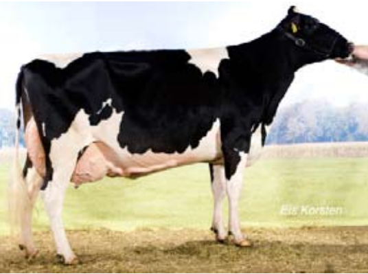
Grashoek Nordika 5 (v. Colombo), seniorkampioene zwartbont Prod.: 3.00 324 11.083 5,04 3,77 lw 112