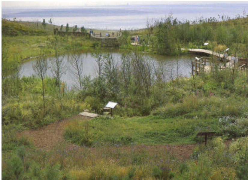
Figuur 6. Steigers en vlonders brengen de mens en daarmee een potentiële verstoringbron van vogels dicht bij het water.