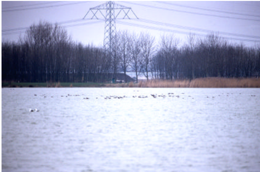
Figuur 2. Meeuwen beginnen zich te verzamelen op hun slaappleaats, de Zevenhuizerplas.