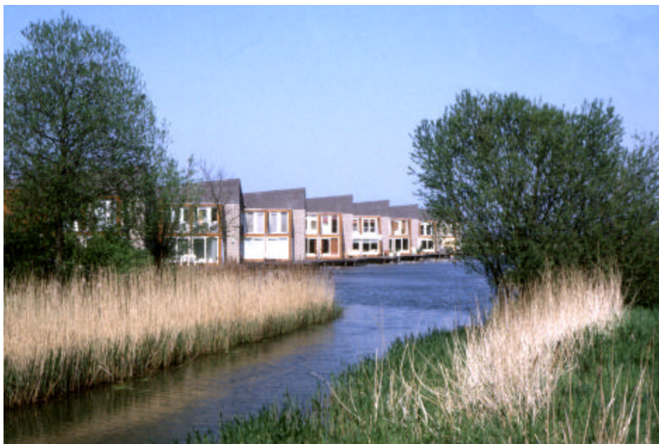
Figuur 4. Langgerekte maar smalle, bochtige watergangen in combinatie met onoverzichtelijke oevers vol riet en bomen, zullen geen grote groepen vogels aantrekken.

Bij alle varianten met water geldt met het oog op de vliegveiligheid dat de bedoeling moet zijn onoverzichtelijke situaties te scheppen. De risicosoorten voor de luchtvaart zijn over het algemeen watervogels en meeuwen. Ze zoeken veiligheid op de open vlaktes. Overzicht en afstand tot mogelijk bedreigende situaties zijn daarbij belangrijke variabelen. Een bomenrij belemmert deze vogels het uitzicht, dat vinden ze niet prettig. Varianten voor de Boterdorpsche Plas moeten dus altijd kleinere waterpartijen bevatten met daaromheen een zoom van bomen of andere uitzicht belemmerende obstakels (figuur 4). Lengte en breedte van de waterpartij moeten in verhouding tot elkaar staan. De smalste diameter van het water is de afstand waarop vogels de veiligheid beoordelen. Een langgerekte waterpartij die smal is zal geen grote groepen vogels aantrekken. Is de waterpartij daarentegen breed dan moet de lengtemaat ervoor zorgdragen dat er geen overzicht en gevoel van veiligheid kunnen ontstaan. Dat kan betekenen bochten, afsnijdingen in de lengterichting. De vorm kan kortom heel sterk bepalen of een waterpartij door vogels aantrekkelijk wordt bevonden. Voor het bepalen van een acceptabele maat voor de smalste diameter moet in de orde van grootte van maximaal 50 meter worden gedacht.