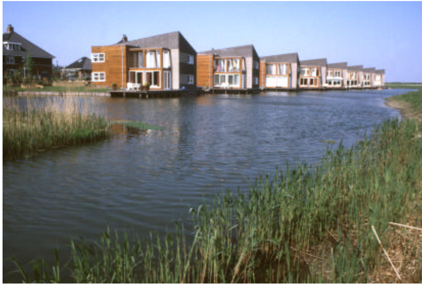
Figuur 5. Huizen met veranda's en balkons direct aan het water vormen een bron van verstoring die het wateroppervlak onaantrekkelijk maken voor grote groepen vogels.

meerdere vormen aannemen. In deze studie zijn enkele voorbeelden opgenomen ter inspiratie. Bij deze benadering is er sprake van visueel kleinere waterpartijen. Er kunnen verrassende en in trek zijnde woningtypen worden aangeboden, er kan worden gewerkt met over water hangende balkons, balustrades, veranda's (figuur 5) steigers en vlonders (figuur 6). Op deze wijze ontstaat het type verstoring dat vogels niet prettig vinden. Een gespreide en onverwachte, niet altijd direct te lokaliseren verstoring die voor vogels bedreigend is. Met het oog op de onrust voor vogels moeten de huizen wel direct aan het water gesitueerd worden. Met gebruik van niet opstaand groen moet de volgorde dan zijn: water-huizen-groen.