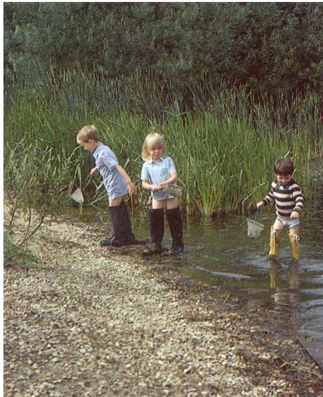
Figuur 7. Geleidelijke land/water overgangen zijn 'noodzaak' in een nieuwbouwwijk met veel jonge kinderen.

De oevers kunnen het beste licht hellend worden vormgegeven. Geleidelijke overgangen zijn goed ook uit oogpunt van veiligheid (figuur 7). Er kan worden gewerkt met plas/dras oevers of met zogenaamde vooroevers. Er moet voorkomen worden dat de vooroevers droogvallen. Het peilbeheer kan men daarop instellen. De plas zal ongetwijfeld voedselrijk worden, vanwege de ligging in het oude veen. De diepte maakt niet zoveel uit, wellicht niet zo diep dat er in de zomer een spronglaag ontstaat. Het ligt voor de hand dat de plas een zekere waterbergende functie krijgt, het waterpeil zal hoog worden gehouden en dat is tevens goed met het oog op het bouwen in veen, om te voorkomen dat de bodem inklinkt.