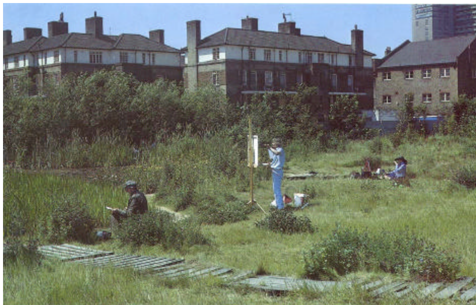
Figuur 3. Stadsnatuur moet uitnodigen om door mensen te worden gebruikt en beleefd. Dit werkt de gewenste onregelmatige vormen van verstoring in de hand (foto E. Malcolm 1986).

Als in plaats van een plas wordt gedacht aan een park van enige omvang, dan dient gewaakt te worden voor de vestiging van grote koloniebroeders zoals roeken, blauwe reigers en aalscholvers. Hoewel dit geen hoogvliegers zijn kunnen vluchten naar foerageergebieden risicoverhogend zijn vooral door de trek van blauwe reiger en roek naar het terrein van Rotterdam Airport.