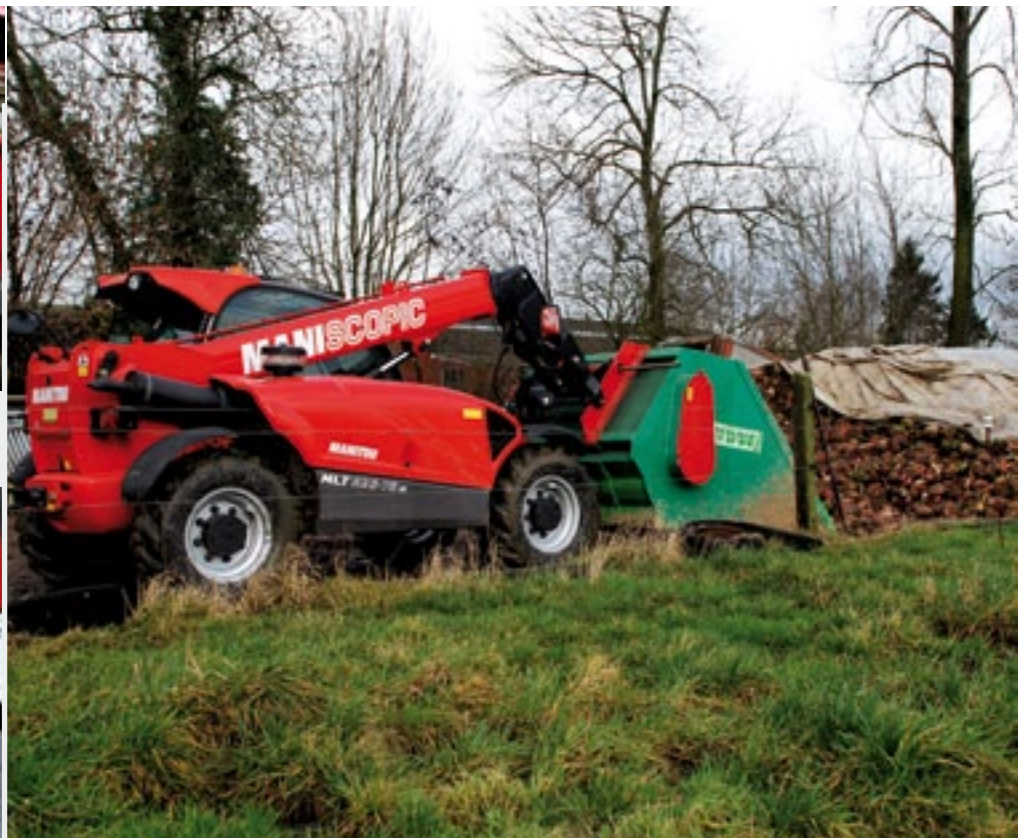
De MLT 625 verreiker van Manitou valt vooral op door zijn afmetingen. De compacte verreiker kan net wat meer dan een minishovel en wat minder dan een grote verreiker.