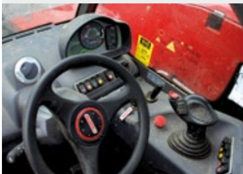
De multifunctionele hendel van Manitou ligt lekker in de hand.