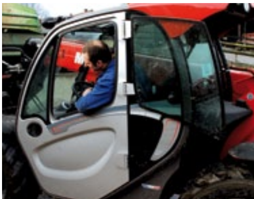
De ruime cabine geeft goed zicht rondom. De ruit in de deur is geopend te vergrendelen..