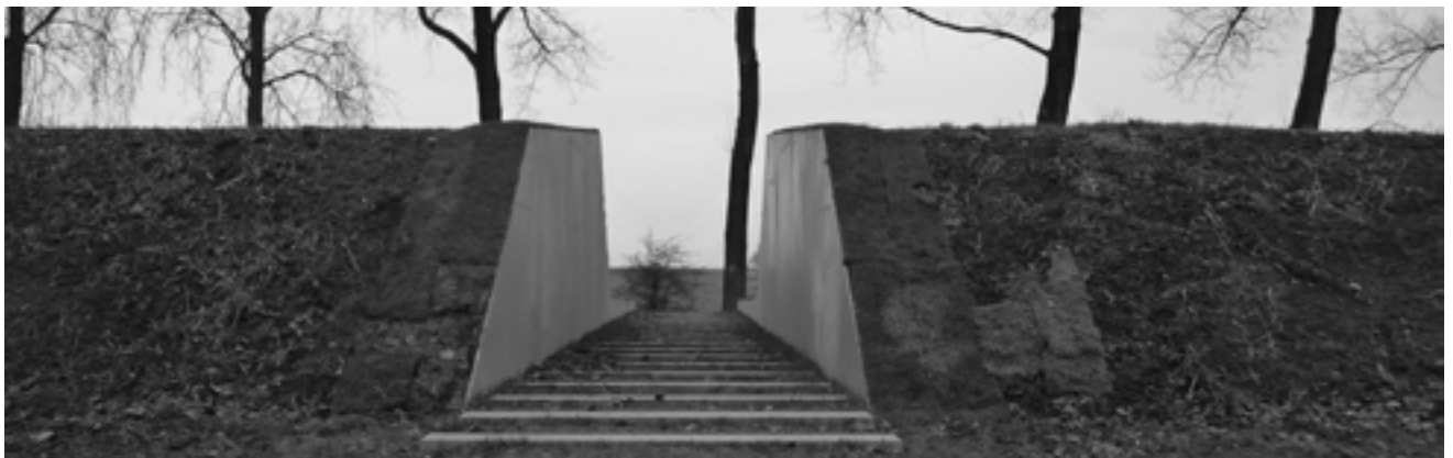
Figuur 5. Gedekte gemeenschapsweg, Houten

Een ruimtelijke visie om de hoofdweerstandslijn, de achterlijn van de waterlinie, manifest te maken. Op markante punten wordt een snede door het landschap gemaakt. Zij geven de passant een nieuw perspectief op de omgeving, gekoppeld aan de militaire kijk op het landschap vanuit wetenschap van de waterlinie.