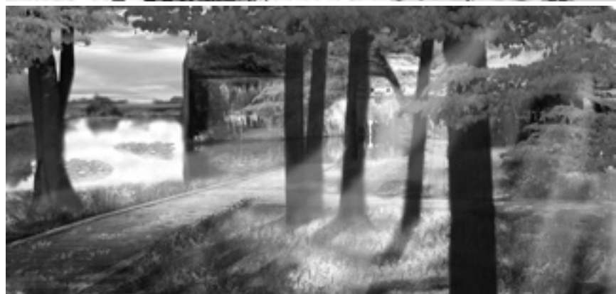
Figuur 3. Gebiedsvisie Lunetten, Utrecht De versnipperde, ontoegankelijke zone rond de Lunetten wordt, op basis van Linie-karakteristieken, ontwikkeld tot een samenhangende, attractieve stadsentree annex uitloopgebied, met fraaie gezichten voor alle honderdduizenden passanten en goed bereikbaar voor de stedeling.