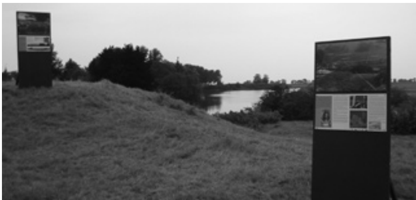
Figuur 6. Muizenfort, Muiden

Voor de dijk langs het inundatiekanaal vanaf Honswijk is een restauratieplan gemaakt. Alle grondlichamen zijn in oorspronkelijke staat terug gebracht. Op twee plekken is een bijzonder element toegevoegd: een coupure en een trap, om de beleving van het werk te verrijken.