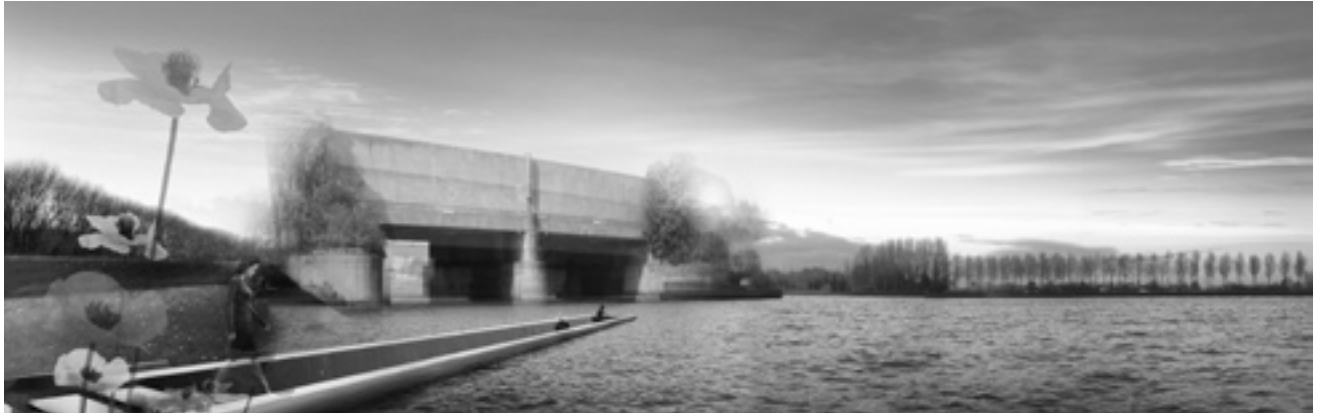
Figuur 4. Visie Hoofdweerstandslijn

Een ruimtelijke visie om de hoofdweerstandslijn, de achterlijn van de waterlinie, manifest te maken. Op markante punten wordt een snede door het landschap gemaakt. Zij geven de passant een nieuw perspectief op de omgeving, gekoppeld aan de militaire kijk op het landschap vanuit wetenschap van de waterlinie.