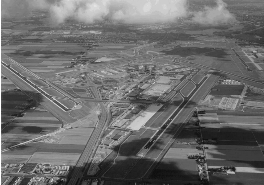
Luchtfoto schiphol: Schiphol: toekomstig retentiegebied?