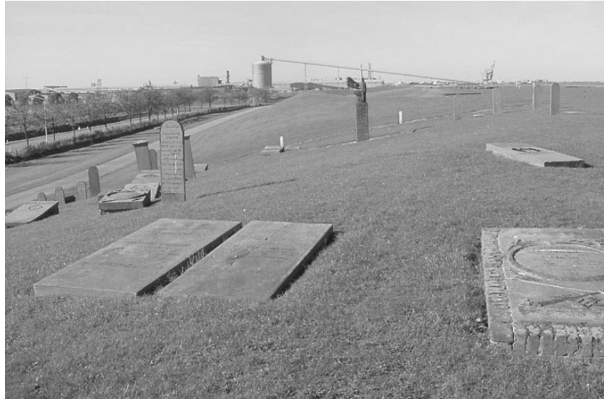
Oterdum: Monument voor het verdwenen dorp Oterdum. Op de achtergrond de industrie van Delfzijl

Maar er zijn zeker verschillen tussen de huidige ruimtelijke ordening en het verleden. Zo waren de burgers vroeger niet zo mondig als nu. Ten eerste was de informatievoorziening nog niet sterk ontwikkeld. Ten tweede hadden burgers minder