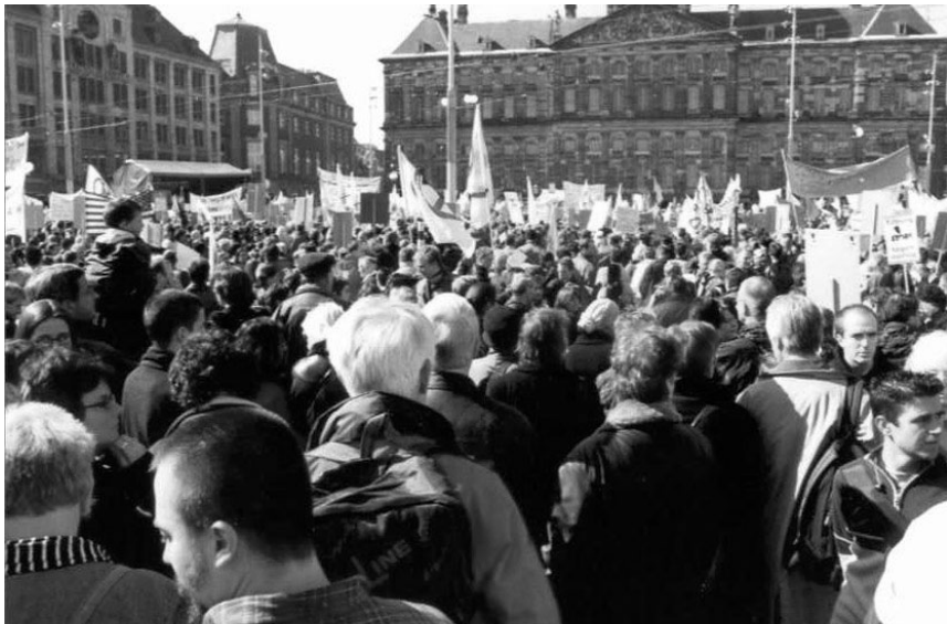
'Mondige burgers' tijdens een demonstratie op de Dam

oorlogsjaren weer een woning en een baan te kunnen bieden. En het doel van de aanleg van de Deltawerken was duidelijk: geen herhaling van de watersnoodramp uit 1953 en het zeker stellen van een water-vrij Nederland. Deze gedachte werd gesteund door duizenden meelevende mensen die bij het verdere verloop betrokken waren.