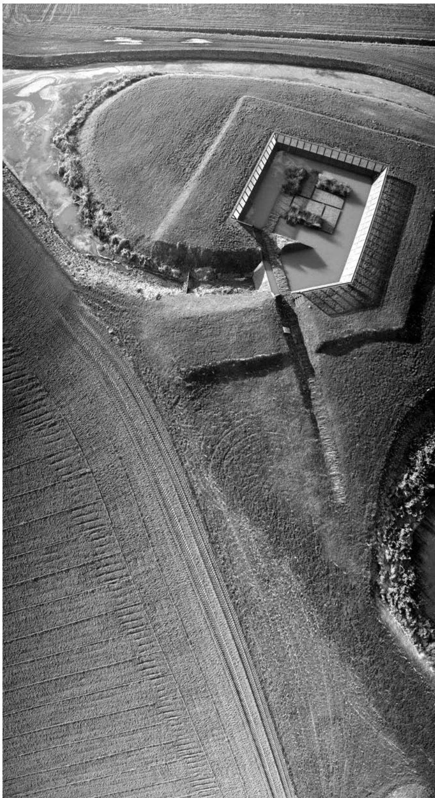
Het Fort voor het water, kunstproject, 'was getekend, de Runde'. Door aanzet van een cultureel proces met een beeldstructuurstudie is een fossiele veenkreek teruggebracht in het landschap wat heeft geleid tot een totale gebiedsontwikkeling, waaronder dit Fort.

lokale recept, hoe gaan mensen met elkaar om? Deze vragen zoek ik ook op in het verleden van een gebied, en dat gaat niet anders dan de analyse van Piet, en ook bij mij begint dan het zoeken naar lijnen. Misschien nog nadrukkelijker dan Piet pleit ik voor het stellen van voorwaarden waarin mogelijk het door de opdrachtgever opgestelde programma ruimte vindt, maar als het even kan een kiem in ligt opgesloten voor nieuwe, onbekende ontwikkelingen. Hier ligt een subtiel maar wezenlijk onderscheid tussen de hogepriester van de genius loci en de identiteitszoeker. De eerste verklarend en uitleggend, de tweede vragend en gidsend. In mijn ogen past de tweede opvatting beter bij onze tijd Het biedt meer kans op vernieuwing van gedachtegoed, meer kans op verwerven van draagvlak, meer binding tussen landschap en haar bewoners. Beide vormen past de ontwerper bescheidenheid en verantwoordelijkheid, we zijn een schakel tussen vervlogen tijden en de tijd die komt.