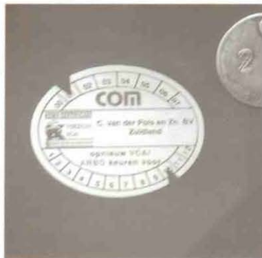
"Ieder jaar worden alle machines van Cromstrijen door huisleverancier Pols VCA gekeurd."

daar met vier mensen twee weken mee kwijt. Al met al betekent dat een productiestijging met een factor 4." Bestebroer: "Met de machines die we eerst hadden bleef het met holle pennen beluchten vaak achterwege, omdat we daar geen tijd voor hadden. Beluchten met massieve pennen ging nog wel. Maar dan doe je niets aan je viltbestrijding en dat begon bij ons toch een probleem te worden." Naast de Core Harvester heeft Cromstrijen ook geïnvesteerd in de nieuwe beluchter van Redexim: de Mustang Vertidrain. De oude Wiedenmann wrikbeluchter van Cromstrijen is daarmee op