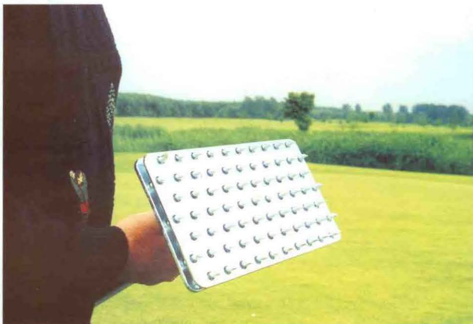
Een handig apparaatje om door te zaaien. Prikken, grassaad erop, inborstelen en klaar