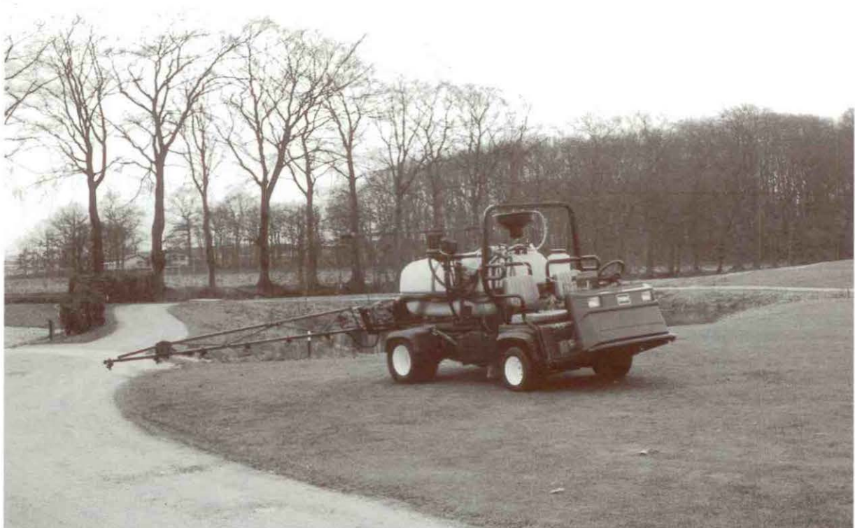
De Toro Workman is uitgerust met een 21 pk vloeistof gekoelde tegengebalanceerde dieselmotor.