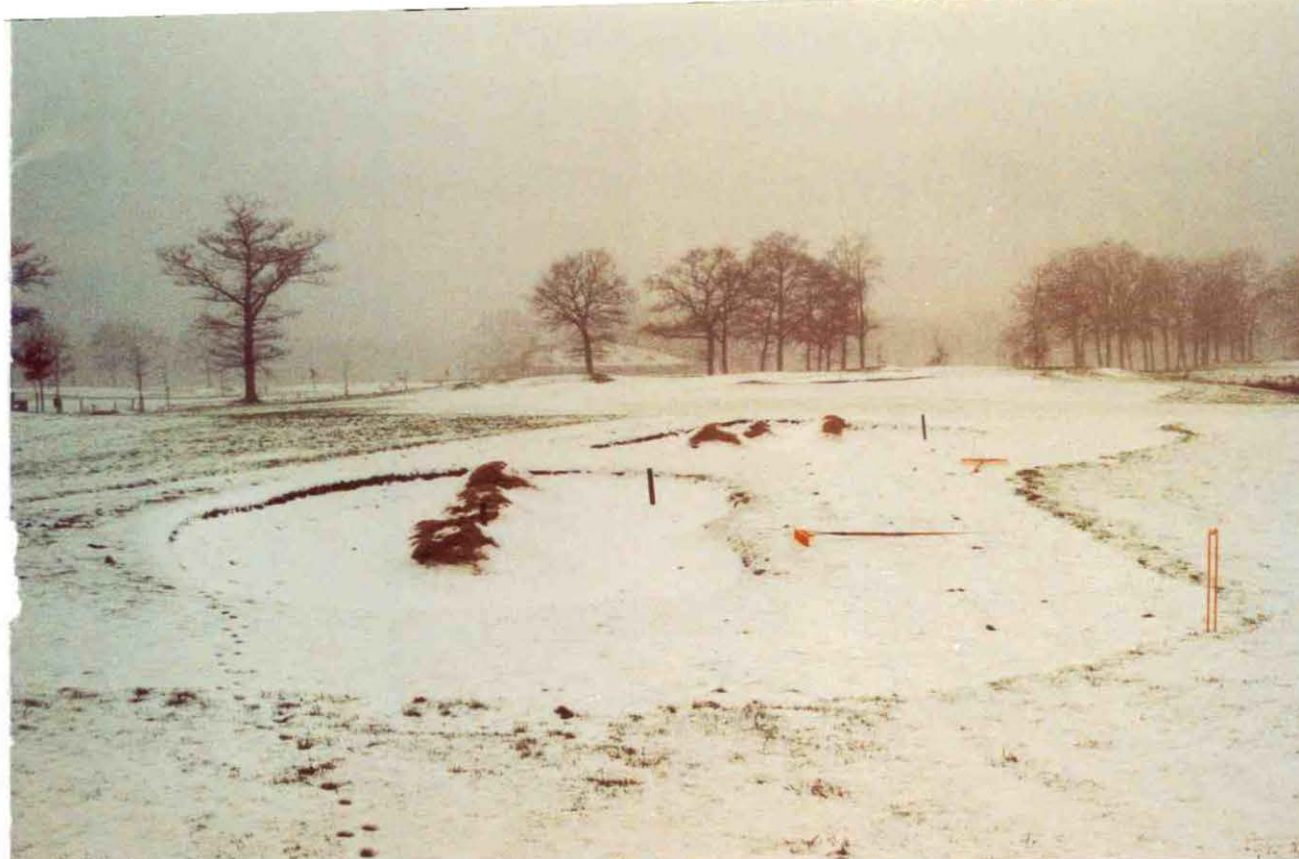
Een van de 9 bunkers die wordt gerenoveerd.