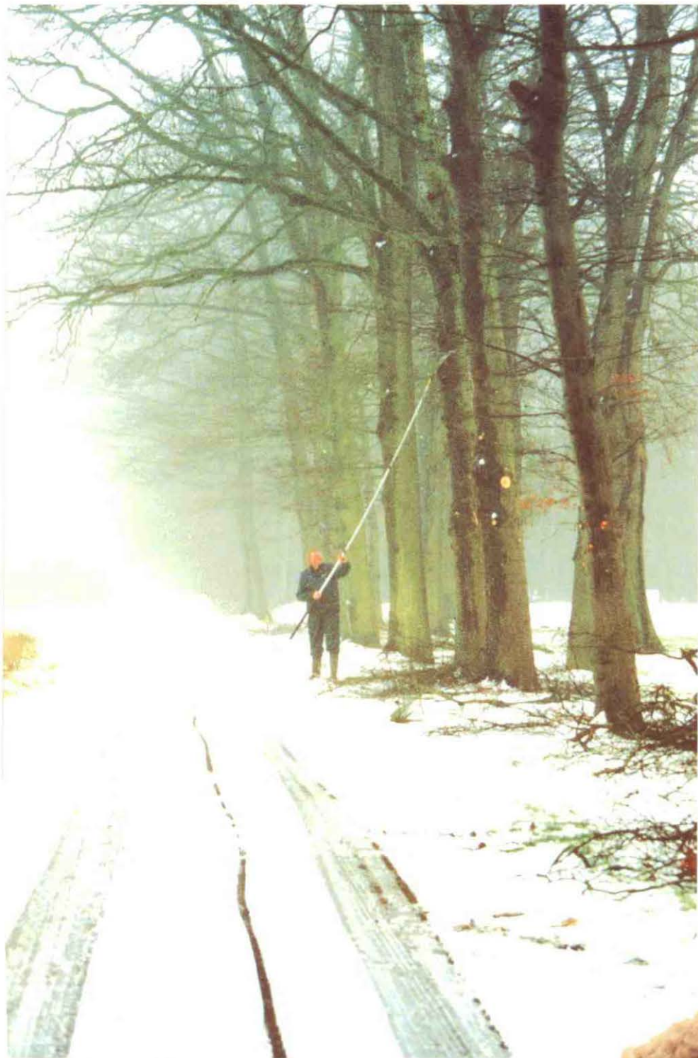
In de winter is er tijd om het onderhoud aan de lanen te verzorgen.

van de Nederlandse greenkeepers: de engerling. Otten: "Ik hoor wel eens greenkeepers praten over bestrijding van engerlingen met Dursban. En afgezien van het feit dat ik niet weet of Dursban nog toegelaten wordt, geloof ik daar ook niet echt in."