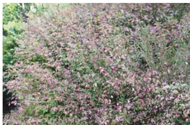
Euonimus var. cilliodentata (kardinaalsmuts)