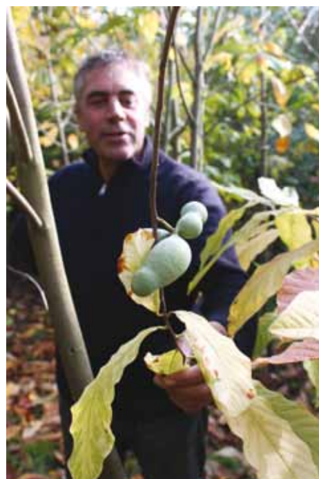
Asimina trilobata (paw paw)

Op de vraag tenslotte wat zijn eigen favoriet in bomenland is, antwoordt de bomengoeroe: “De mooiste boom? Ik weet niet of die wel bestaat. Het hangt vaak ook samen met de plek waar ie staat. Maar als je vraagt wat mijn persoonlijke favoriet is om te kweken, dan is dat wel de Parrotia persica , de ijzerhoutboom. Die komt oorspronkelijk uit Perzië, het huidige Iran. Het is een plant die vier jaargetijden altijd mooi is en die zijn er maar heel weinig.”