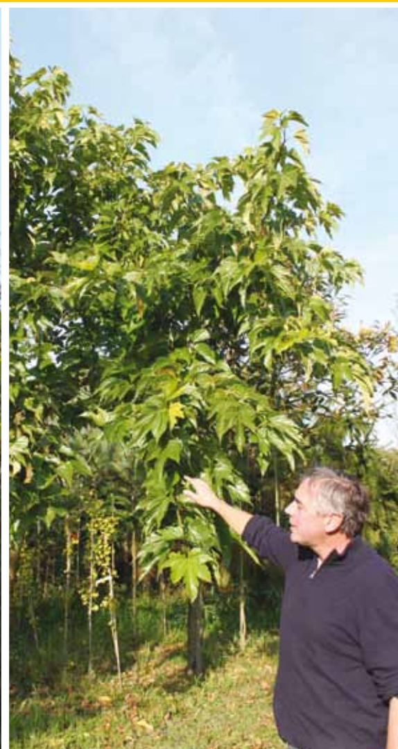
Morus alba 'Macrophylla'