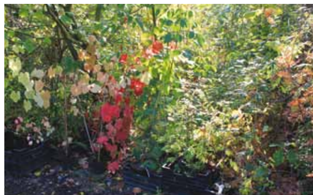
Jonge aanplant met o.a. Vitis coignetiae (rood)