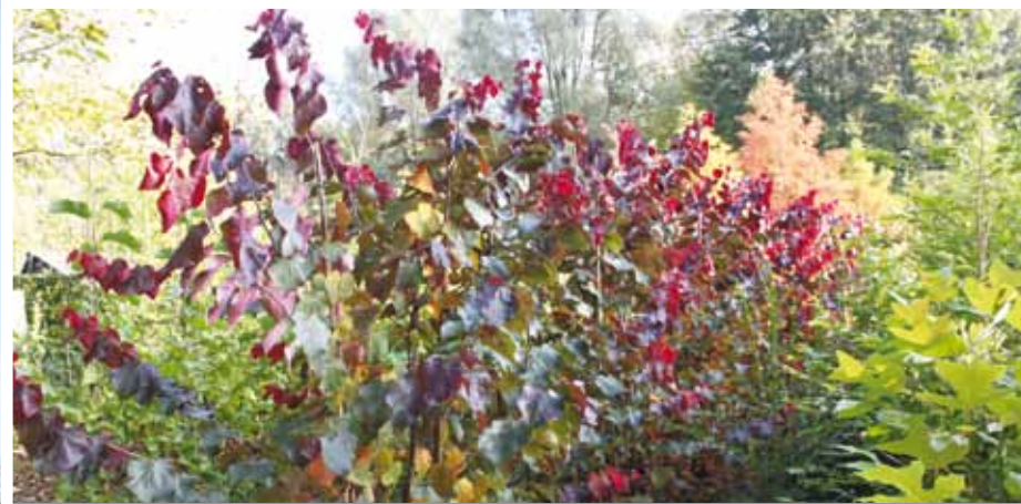
Cercis canadensis 'Forest Pansy'