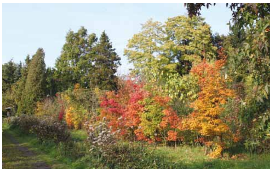
Diverse soorten in kleurrijke herfsttooi.