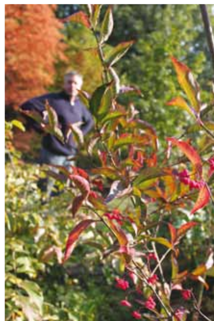
Euonimus europaeus 'Red Cascade'