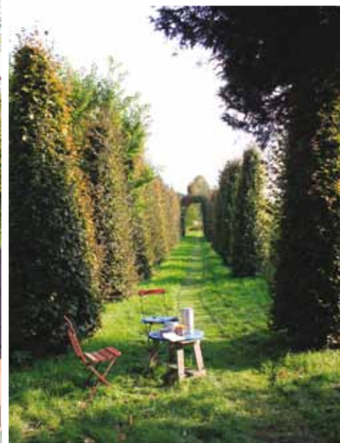
Laantje van Fagus sylvatica 'Atropurpurea'