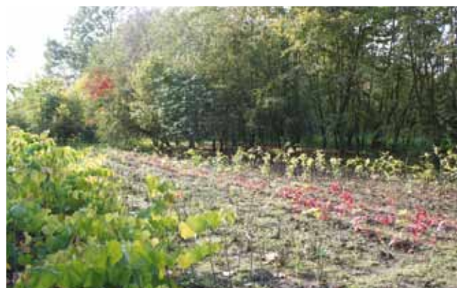
Jonge aanplant met o.a. Oxydendrum