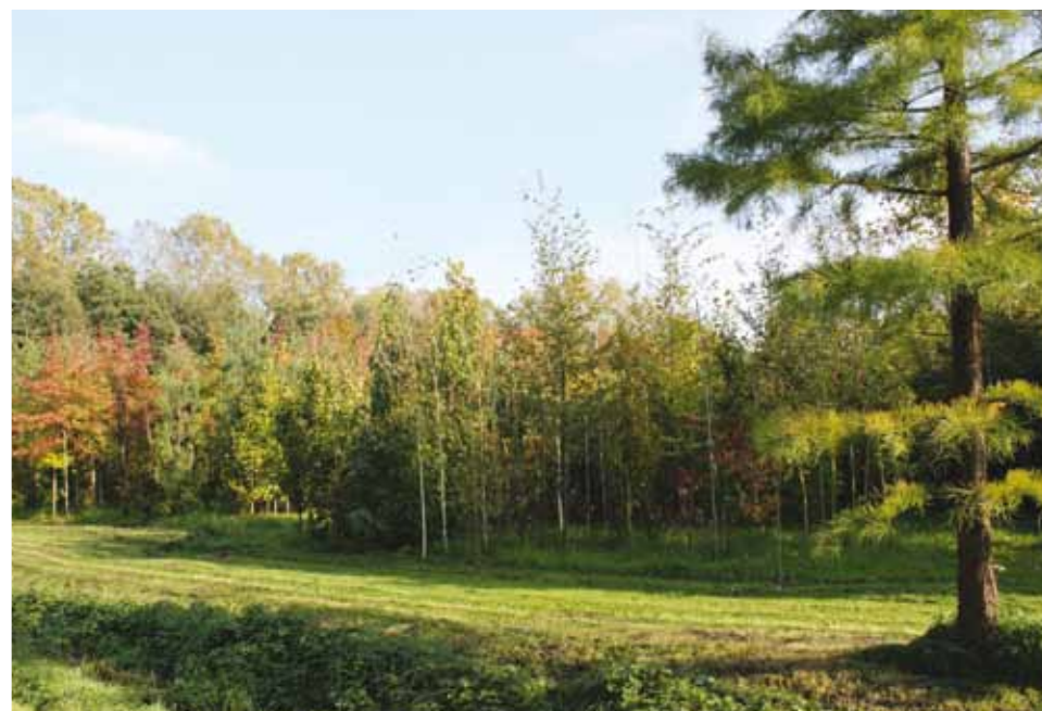
Deel van de kwekerij met rechts een Taxodium ascendens