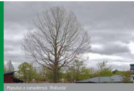
Populus x canadensis 'Robusta'

De drie favorieten van Van Iersel, alhoewel hij daarbij opmerkt dat deze vooroorlogse soorten nu achterhaald zijn door nieuwe en betere populierensoorten: